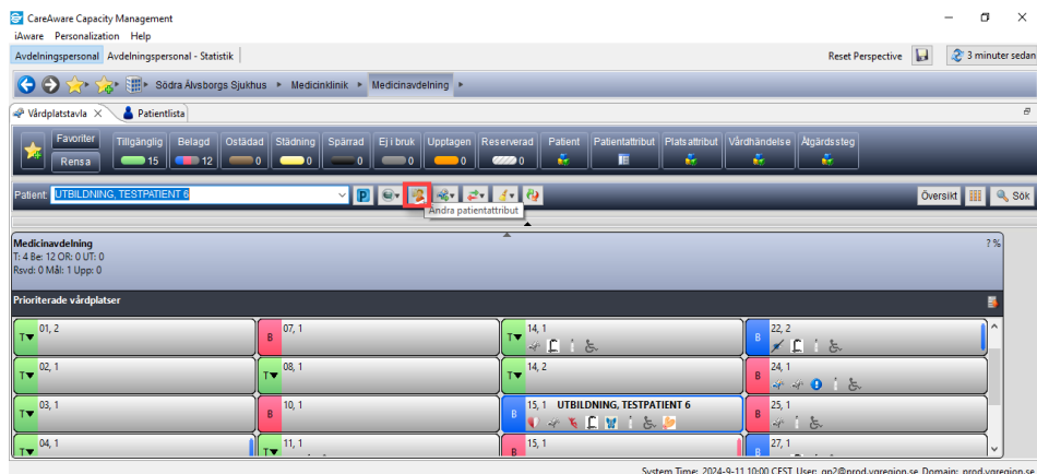
Figur 1. Ändra patientattribut.