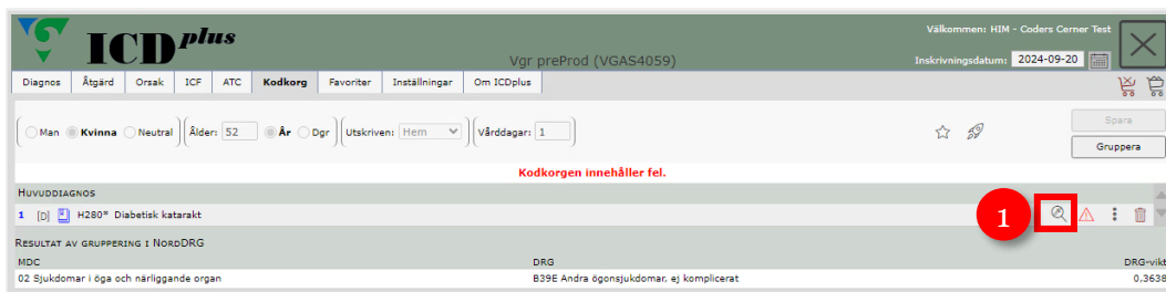
Figur 3 – Tillagd asteriskkod i kodkorgen. 1: Ikonen Sök daggerkod.