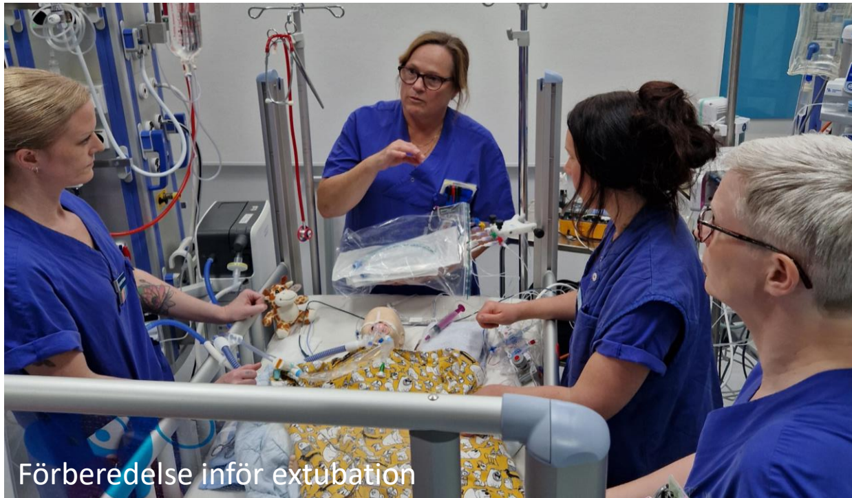
Förberedelse inför extubation