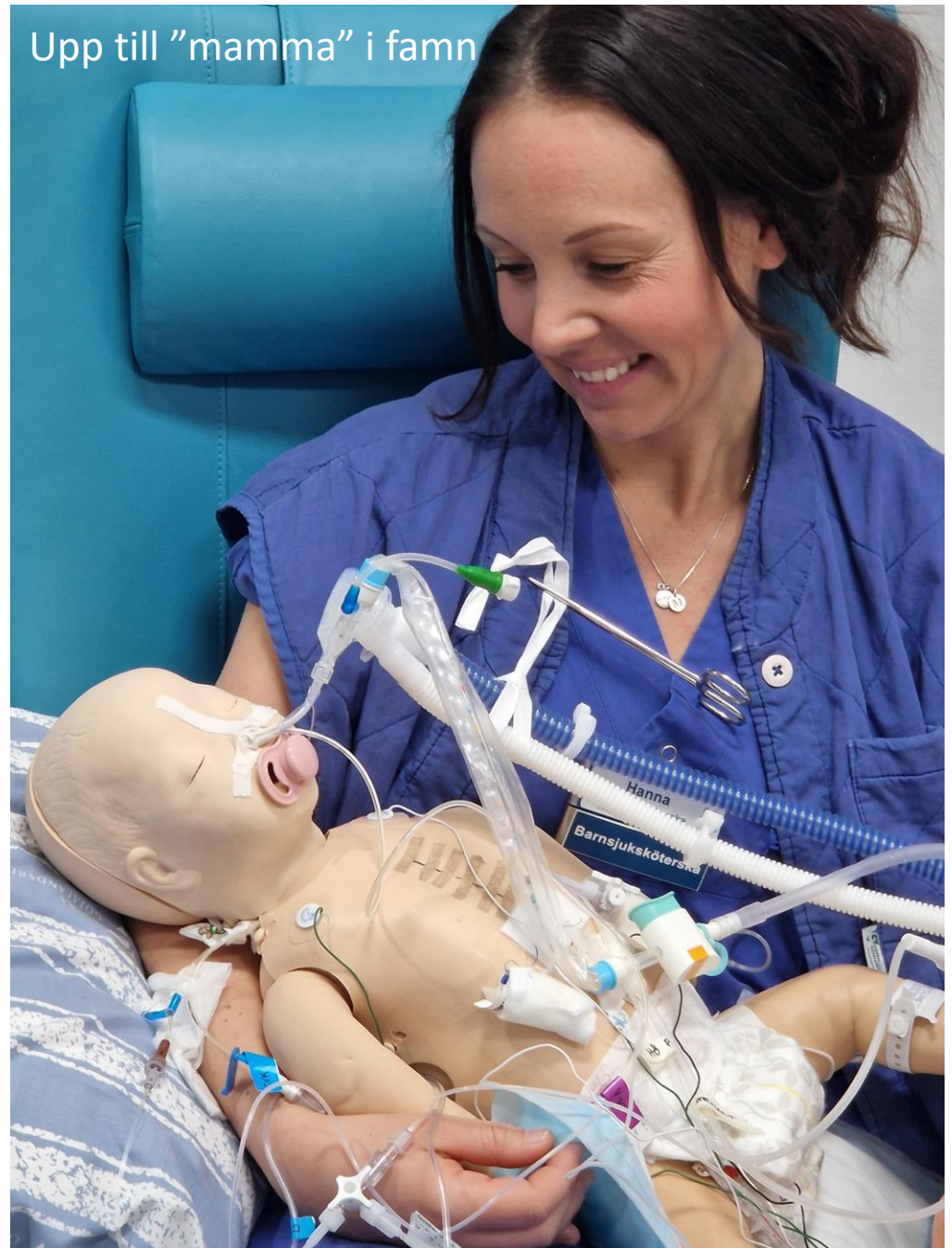
Upp till "mamma" i famn