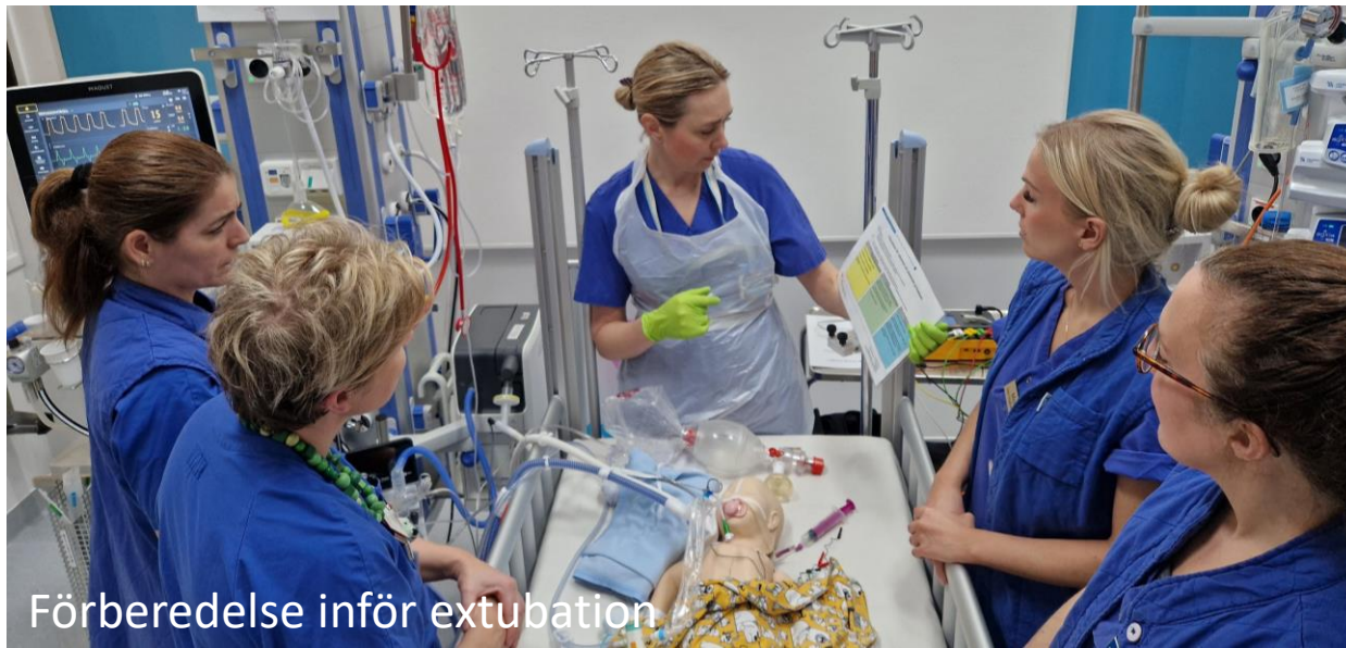
Förberedelse inför extubation