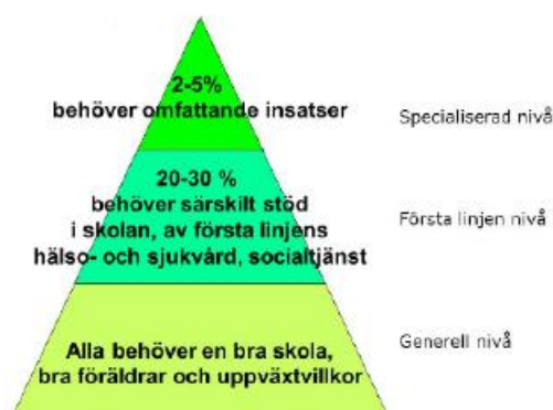
Figur 1: Generella och riktade insatser