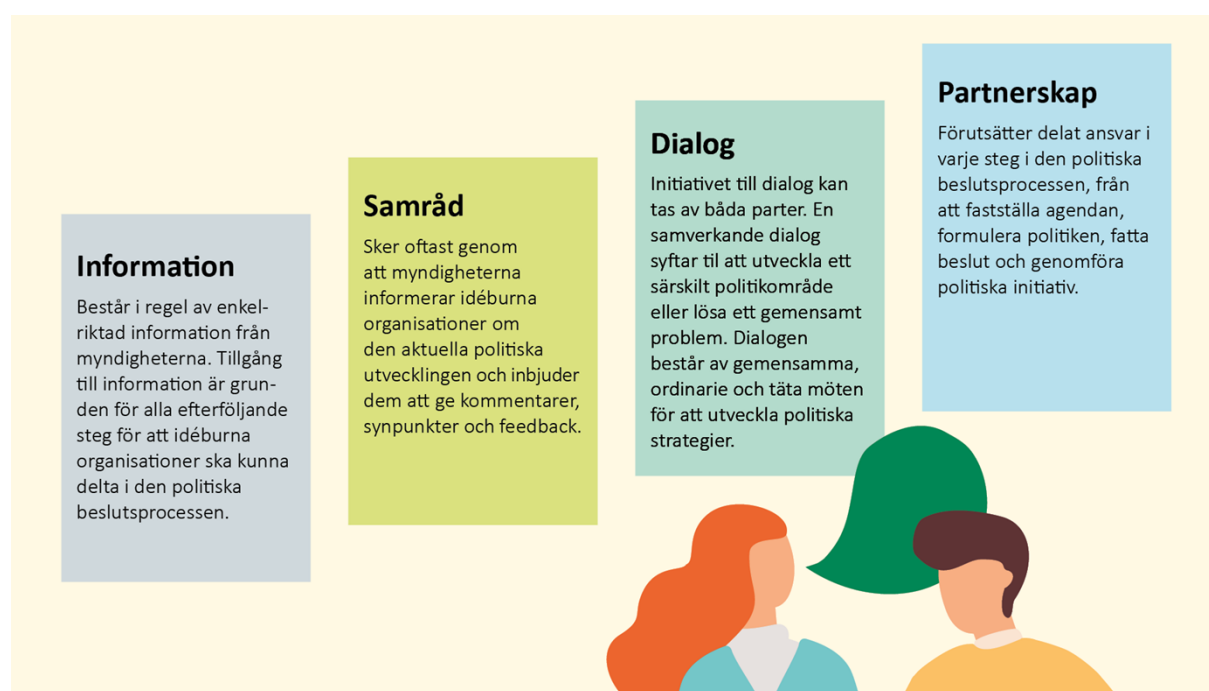
Figur som visar fyra nivåer av delaktighet enligt europeisk kod för idéburna organisationers medverkan i beslutsprocessen

På de sex principerna i överenskommelsen som nämndes på sidan 4 följer fyra nivåer av dialog och delaktighet nämligen; information, samråd, dialog och partnerskap . Nivåerna utgår från den europeiska koden för idéburna organisationers medverkan i beslutsprocessen. 7 Nivåerna ska i överenskommelsearbetet fungera som stöd vid val av aktivitet och strategi för samverkansarbetet för bästa förutsättningar nå de gemensamt uppsatta målen.