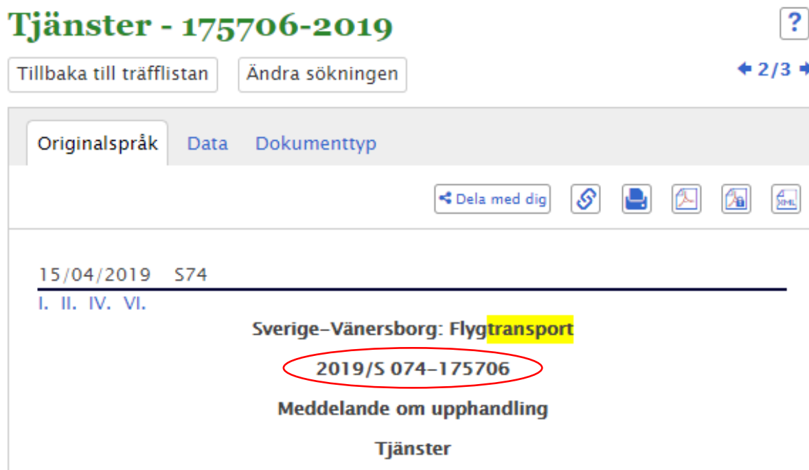
Bild från Ted som visar meddelandenummer i upphandlingsannonsen

I det fall upphandlingen är annonserad i Tenders electronic daily (TED) ska en koppling göras vid efterannonsering av upphandlingen. Det sker genom att i meddelande om tilldelning av kontrakt ange upphandlingens meddelandenummer i Europeiska unionens officiella tidning (EUT).