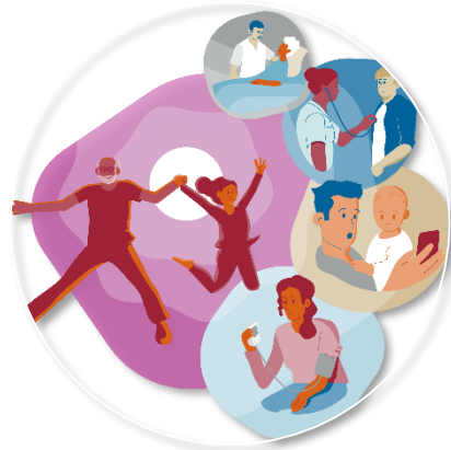
Sammanhållen hälso- och sjukvård