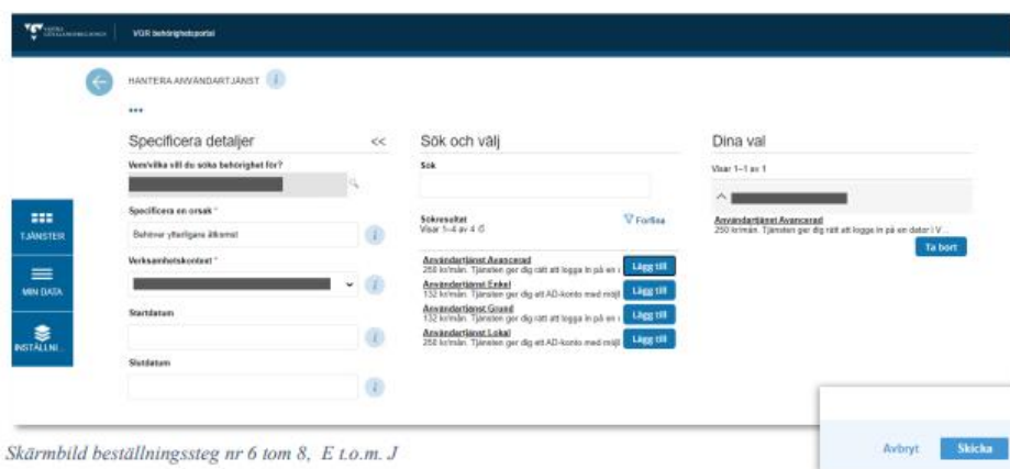
Skärmbild beställningssteg nr 6 tom 8, E t.o.m. J

OBS! Om du i detta läge använder bakåtpilen för att göra ändringar får du två beställningar men endast en användartjänst kommer att tilldelas.