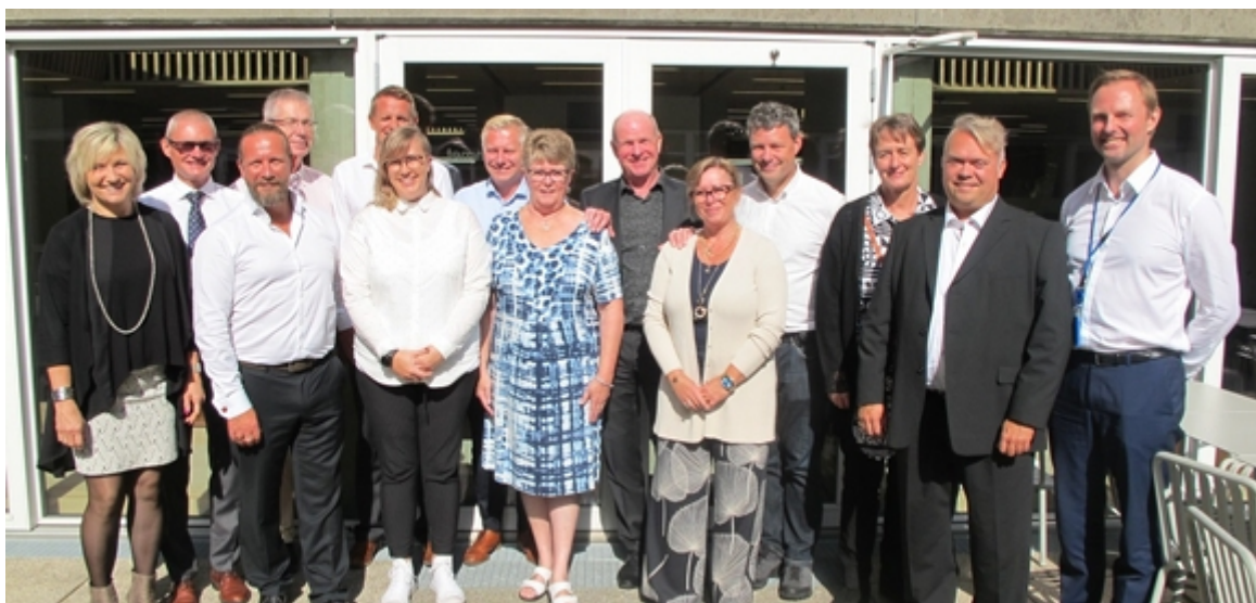
Medlemmar i digitaliseringsrådet

Det här är en kort statusuppdatering om arbetet med den regionala digitala agendan "Smart Region Västra Götaland". Smart betyder för oss att det finns stora fördelar med samverkan och samarbete inom digitalisering i människans tjänst. Andra grupper, strukturer och organisationer gör ett väldigt bra arbete inom sina olika ansvarsområden, både nationellt, regionalt och lokalt. Vi behövs allihop och kan arbeta tillsammans!