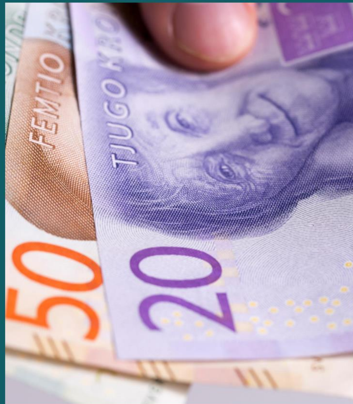
Medel i överenskommelsen går till kommuner, regioner och kommuner och regioner gemensamt. Läs vidare