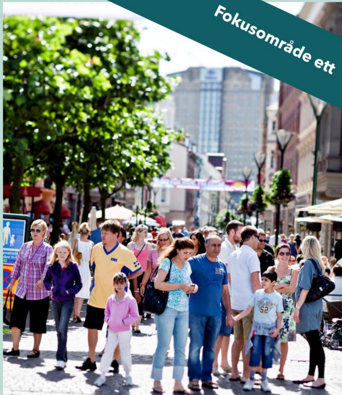
Länen får stöd för att ta fram handlingsplaner, samverka med patienter och brukare och för att införa vård- och insatsprogram och vårdförlopp.