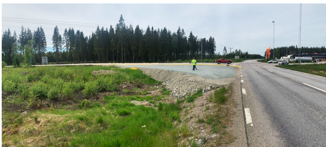
Figur 8. Platsbesök 2021, väg 166