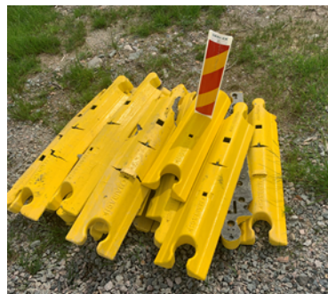
Figur 6. Provisoriska vägkantstöd