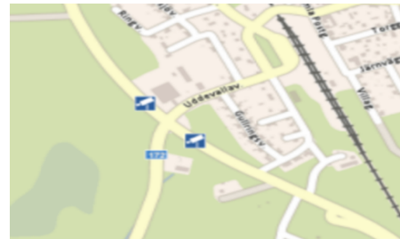
Figur 2. ATK

Korsningen väg 166/172/kommunal väg har cirka 3430 fordon som årsmedeldygnstrafik (ÅDT), varav 200-340 av dessa är tung trafik, mätår 2017. Det finns trafikmätningar som visar en tredubblad trafik, vilket tyder på att flödena varierar. Befintlig hastighetsgräns ligger på 80 km/h för väg 172, 60 km/h för väg 166, och 40 km/h på kommunal väg. Väg 166 har, som tidigare nämnts, etablerad ATK i båda riktningarna. I den södra kvadranten mellan väg 172 och väg 166 ligger ett ställverk.