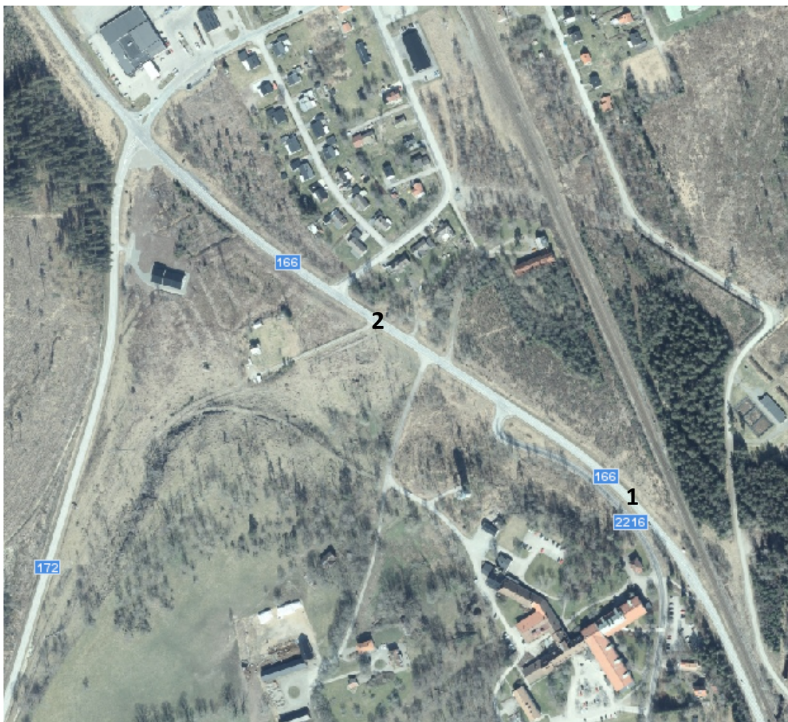
Figur 11. Väg 166, studerade alternativ för gång- och cykelpassage