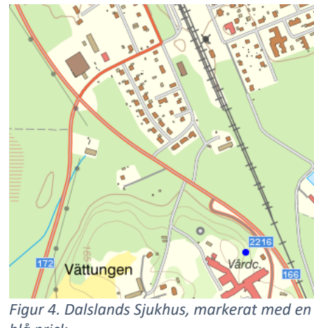
Figur 4. Dalslands Sjukhus, markerat med en blå prick.

Övriga målpunkter, utöver Bäckefors samhälle, är bland annat Södra Skogsägarnas terminal vid Lunnane och bensinstationen/rastplatsen i direkt anslutning till korsningen. Vidare finns även Dalslands sjukhus i utkanten av orten och studiens avgränsning. Det är många oskyddade trafikanter som korsar väg 166 för att ta sig till och från sjukhuset, och fler kan det bli, med tanke på att utvecklingen av Campus Dalsland, se sidan 13.