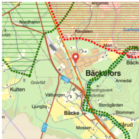
Figur 3. Riksintresse naturvård, friluftsliv och kulturmiljö

Korsningen utgörs av funktionellt prioriterat vägnät (FPV) för godstransporter, dagliga personresor och kollektivtrafik. Korsningen är även primär väg för farligt gods och väg 166 har bärighetsklass fyra, medan väg 172 har bärighetsklass ett. Båda vägarna är cirka nio meter breda, med mittseparering i form av målad linje, samt ett körfält i vardera riktningen. Väg 172 och Uddevallavägen, kommunal väg, har stopplikt mot väg 166.