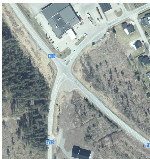
Figur 1. Avgränsningsområde, några hundra meter in på varje väg.

Åtgärdsvalsstudien genomförs enligt etablerad ÅVS-metodik, studienivå mellan, och eventuella åtgärdsförslag enligt fyrstegsprincipen. Den geografiska avgränsningen hålls till korsningen mellan väg 166, väg 172, Uddevallavägen med några hundra meter ut, se figur 1. Som tidigare nämnts avgränsas även åtgärdsförslagen till en fastställd budget om 15 miljoner kronor.