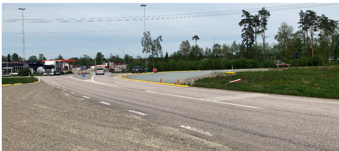
Figur 7. Platsbesök 2021, väg 172 mot kommunal väg