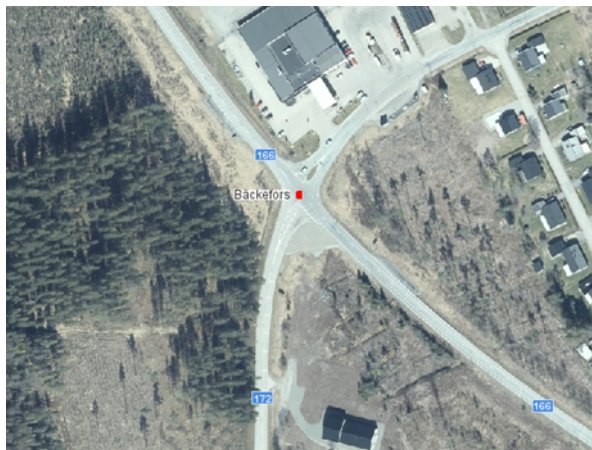
Figur 5. Korsningen i Bäckefors