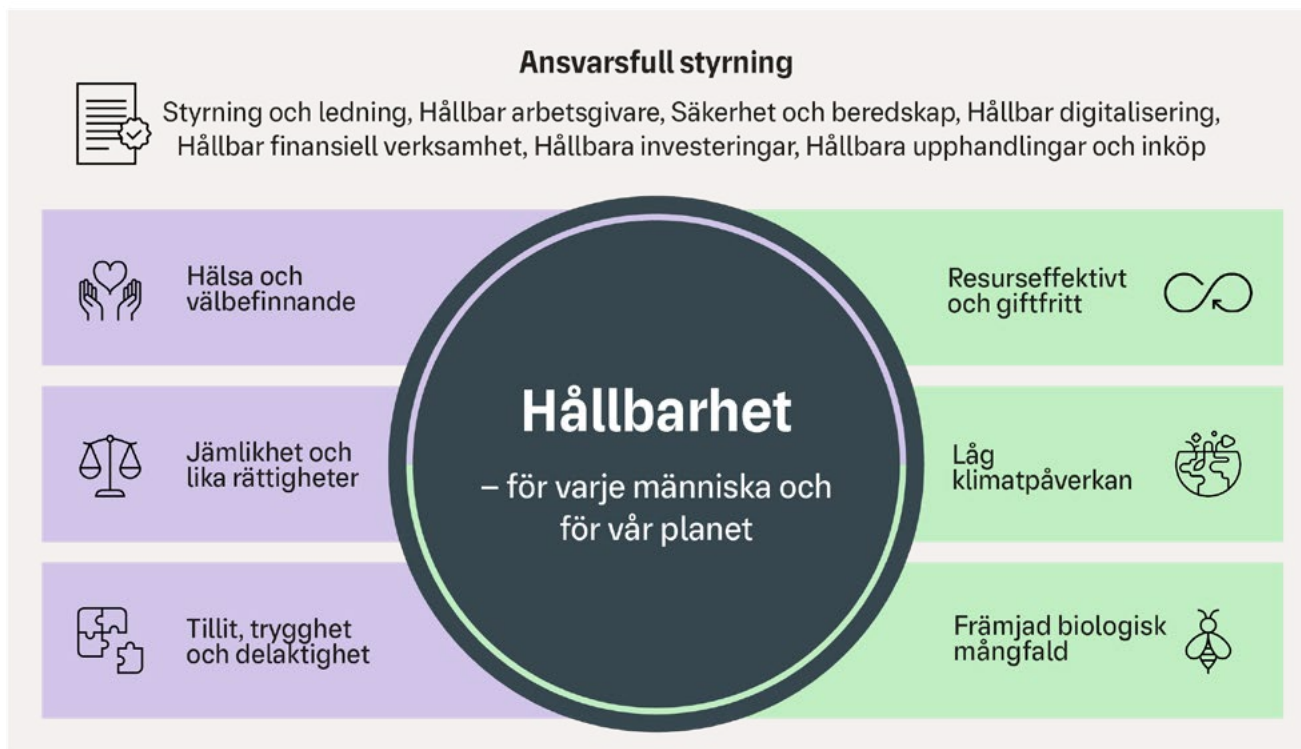
Figur 1. Överblick över Hållbarhetsmål 2030.

De sex övergripande hållbarhetsmålen med tillhörande delmål pekar ut riktningen för VGR:s hållbarhetsarbete. Delmålen konkretiserar vad som krävs för att VGR ska bli en hållbar organisation och bidra till en hållbar samhällsomställning utifrån ekonomiska, sociala och miljömässiga perspektiv. Till delmålen finns målsatta indikatorer på VGR-övergripande nivå. Uppföljning av hållbarhetsmålen sker i samband med VGR:s årsredovisning och omfattar de övergripande målen så väl som delmålen.