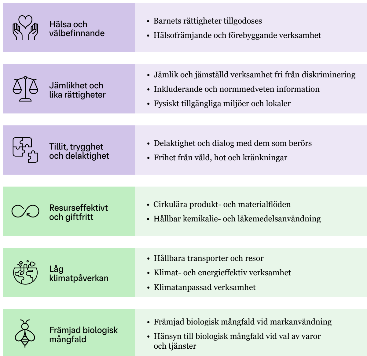
Figur 2. De sex övergripande hållbarhetsmålen med tillhörande delmål.

De sex övergripande hållbarhetsmålen med tillhörande delmål är ömsesidigt beroende av varandra och bildar en helhet. Det innebär att framsteg inom ett mål kan bidra till framsteg inom andra område.