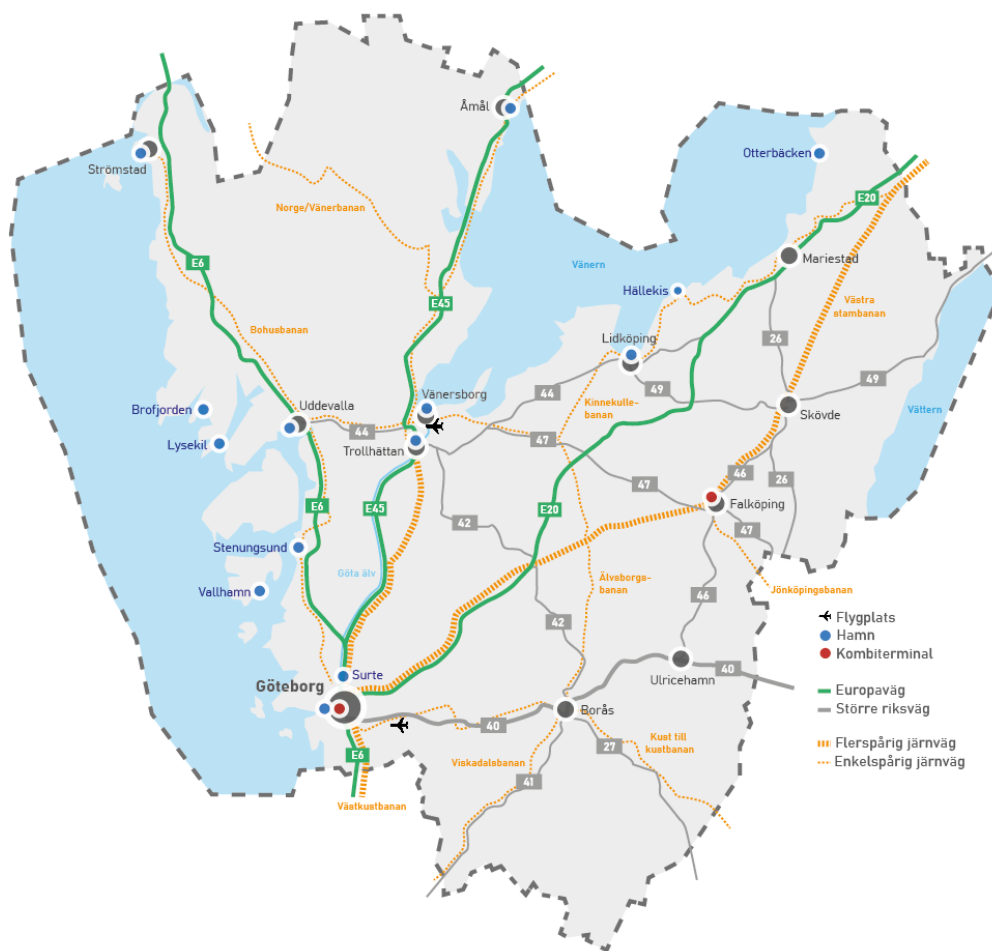
Figur 2. Transportinfrastruktur i Västra Götaland: vägar, järnvägar, hamnar och kombiterminaler.

E6, Rv40, Västra stambanan, Väst kustbanan, Norge-/Vänerbanan, Göteborgs hamn och Landvetter ingår i Core network (stomnätet) inom det Transeuropeiska transportnätet (TEN-T). TEN-T, och i synnerhet stomnätet, är utpekad av EU och utgör ryggraden inom det europeiska transportsystemet för att bland annat möjliggöra effektiva och konkurrenskraftiga godstransporter. E20, E45, Kust till kust-banan, Brofjorden och Strömstads hamn ingår också i TEN-T 4 . Göta Älv och Vänern omfattas av EU:s regelverk för inlandssjöfart vilket innebär att enklare typer av fartyg med lägre bemanningskrav är tillåtna.