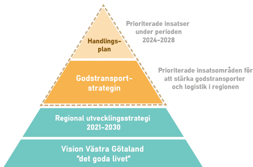
Figur 1. Kopplingen mellan godstransportstrategin och andra styrande dokument i VGR.

Godstransportstrategin är framtagen för att beskriva hur Västra Götalandsregionen (VGR) långsiktigt ska prioritera och satsa för att fortsätta stärka regionen. Strategin och tillhörande handlingsplan utgör kopplingen mellan visioner, mål och åtgärder kopplade till godstransporter inom regionen.