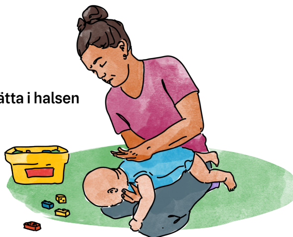
Sätta i halsen