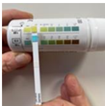
Bild: Avläsning urinsticka och mätskala.