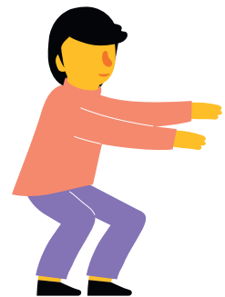
3. Öka fysisk aktivitet

→ I Rörelseguiden kan du hitta inspiration och förslag på aktiviteter: vgregion.se/rorelseguiden