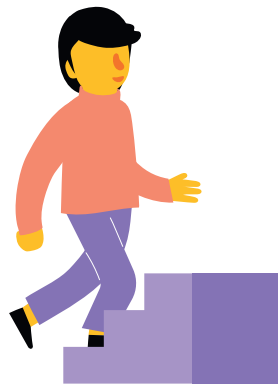
2. Öka vardagsaktivitet