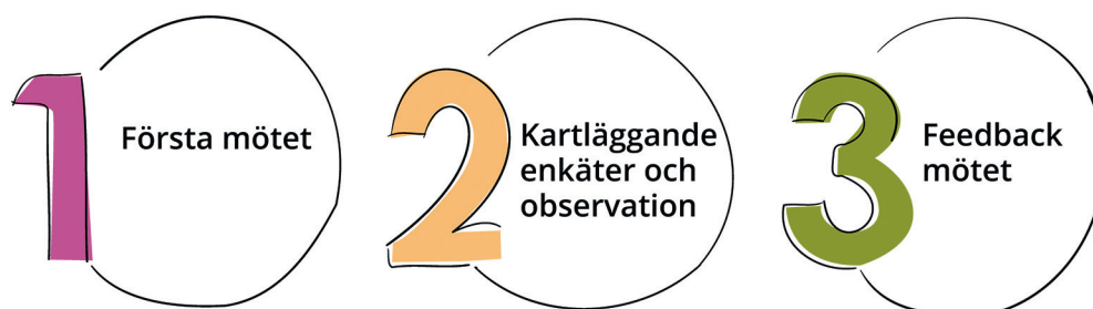
Figur 1. De tre stegen i FCU-arbetets kartläggnings- och feedbackfas.

FCU-arbetet har två faser: a) kartläggning och feedback samt b) någon form av insats. Kartläggningen inkluderar olika kontexter, både hem och skola, och till grund för den ligger frågeformulär ifyllda av barn, föräldrar och förskola/skola samt en videofilmad familjeobservation. Syftet med kartläggningen är att belysa familjens styrkor och utvecklingsområden för att förebygga psykisk ohälsa hos barn. Ett annat syfte är att säkerställa familjens motivation och att familjen får rätt typ av insats. Genom kartläggning enligt FCU