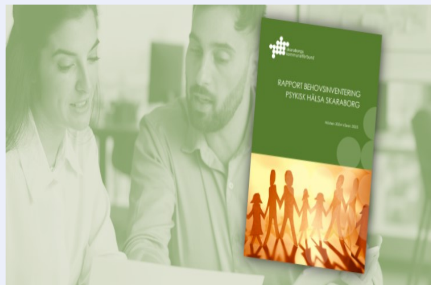
Behovsinventering Psykisk Hälsa