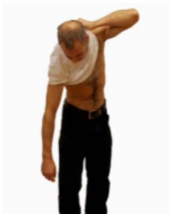
Klä på: börja med den opererade armen