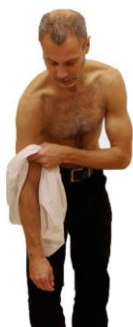
När du klär på dig: börja med den opererade armen

Tag av axelförbandet dagligen för att sköta hygien, byta kläder och träna. Låt armen hänga avslappnat nedåt och luta dig åt sidan och för att komma åt att tvätta dig under armen. Denna position underlättar också att ta av och på skjorta/blus/t-shirt.