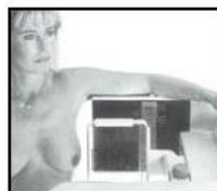
Illustration ML-projektion (medio-lateral)