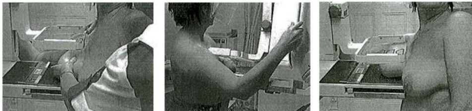
Illustration CLEO-projektion (Cleopatra)