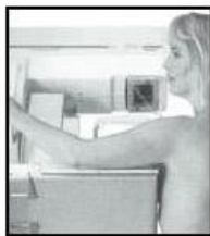
Illustration MLO-projektion (medio-lateral-oblique)