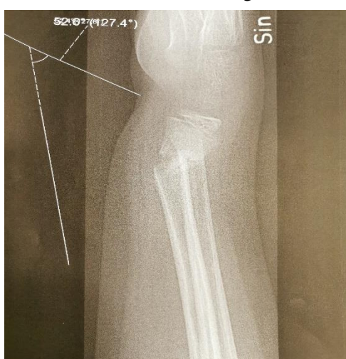
B. Röntgen vid avgipsning efter 3 veckor. Dorsalböckning cirka 40°.