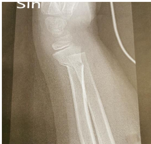
A. 8-årig pojke med metafysär radius fx med cirka 25° dorsalböckning.