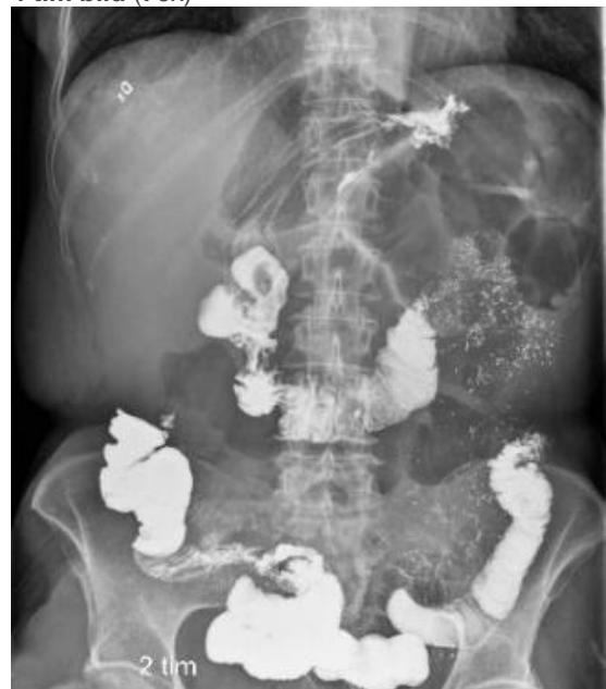
4 tim bild (t ex)

Ventrikeln med i bild. Tidsangivelse med i bild. All kontrastfylld tarm avbildad.