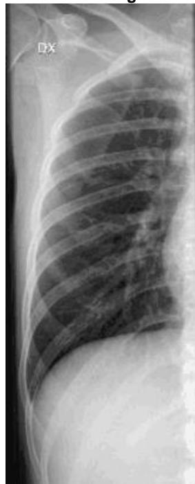
Frontal övre höger