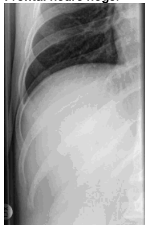
Frontal nedre höger