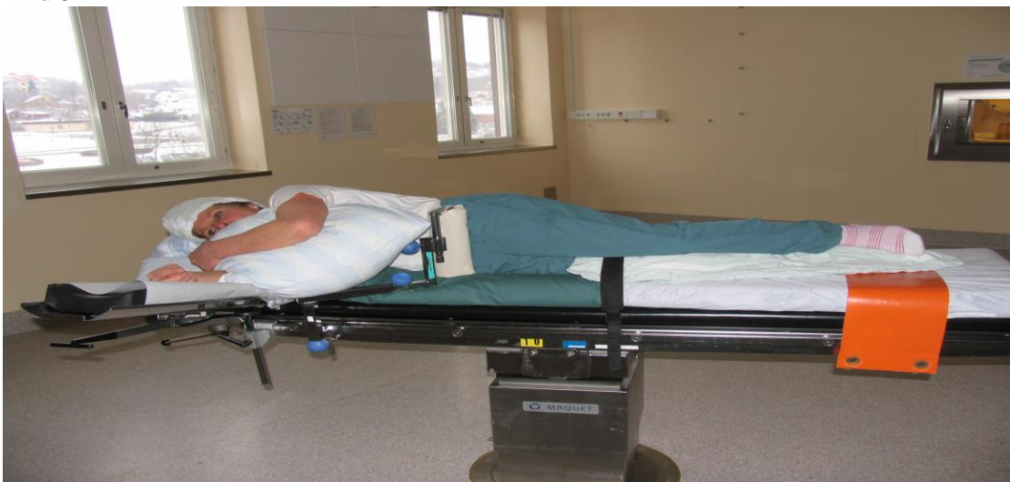
Bild 6 nya höftstöden