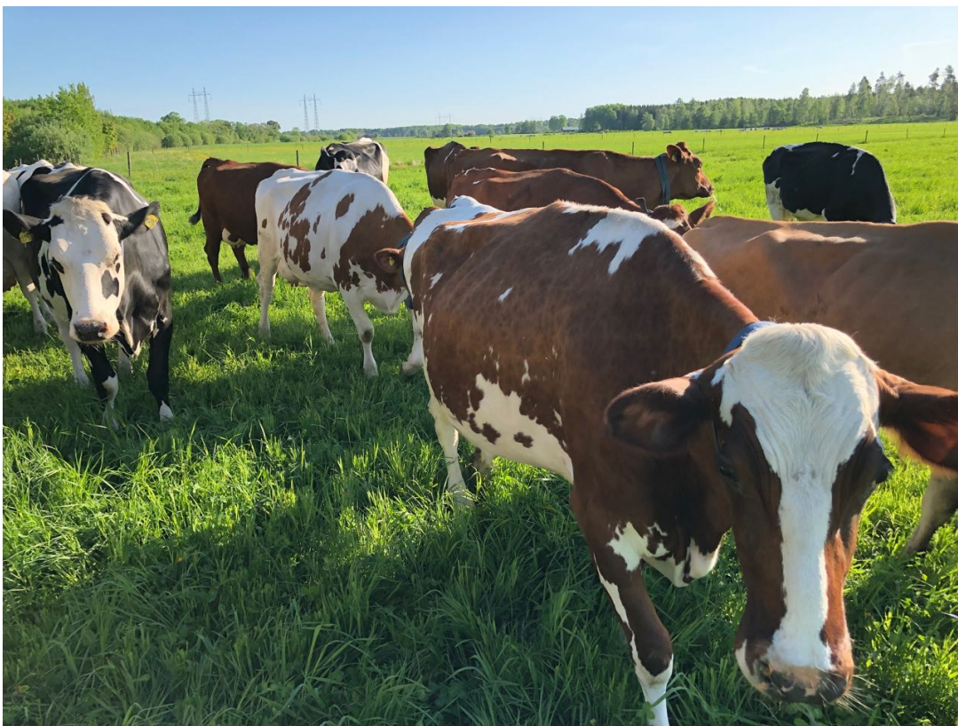
Sötåsens nötkreatur på bete.

Det innebär bl a att naturvårdsplanen ifrån 1999 revideras, uppdateras och kompletteras.