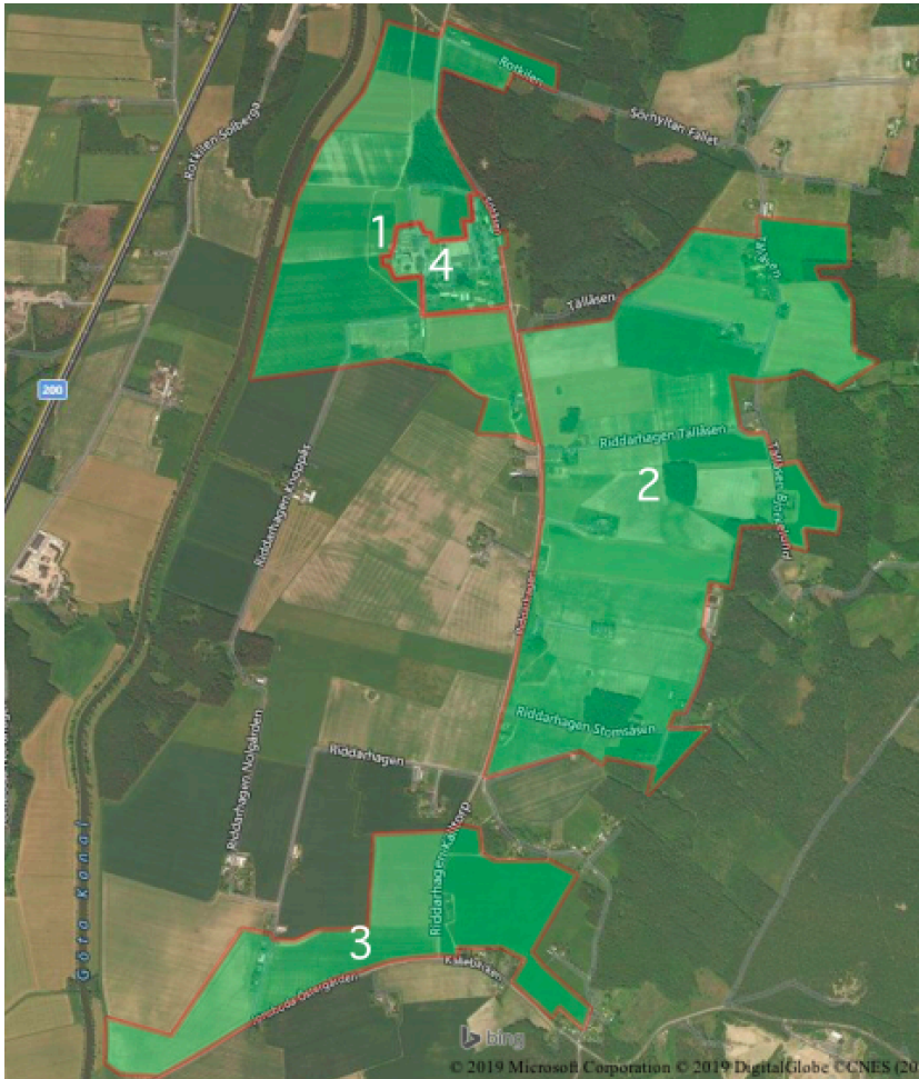
Karta över skötselområden, numrerade 1-4. Område 1) Väster om stora landsvägen, huvudsakligen lerjord 2) Öster om stora landsvägen 3) Linneas, arrendera mark 4) Skol- och parkområdet.