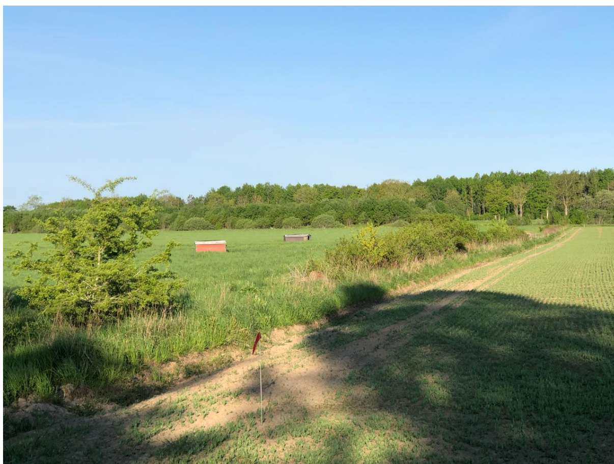
Lähäck/busplantering i fältkant.