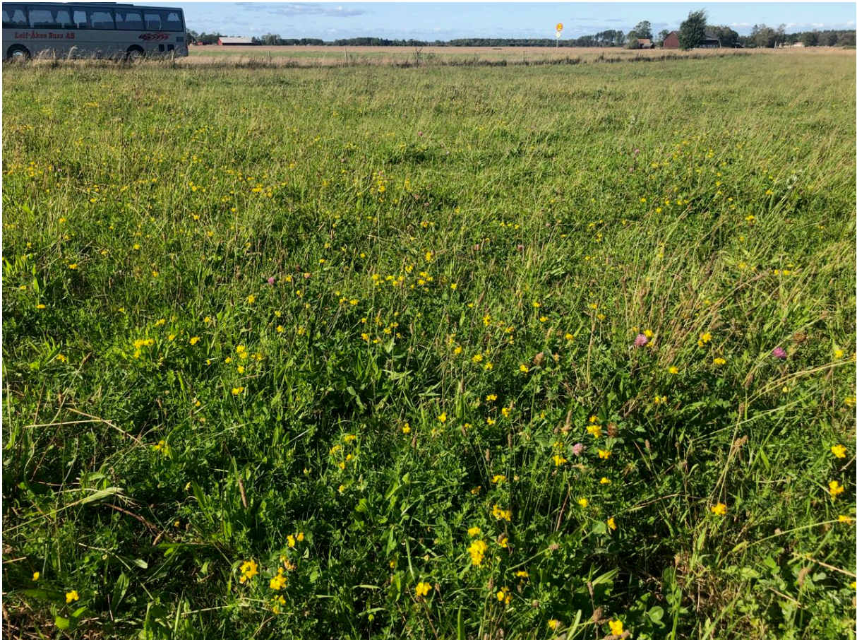
Betesvall med rik blomning av käringtand, till stor nytta för pollinatörer som humlor och fjärilar.