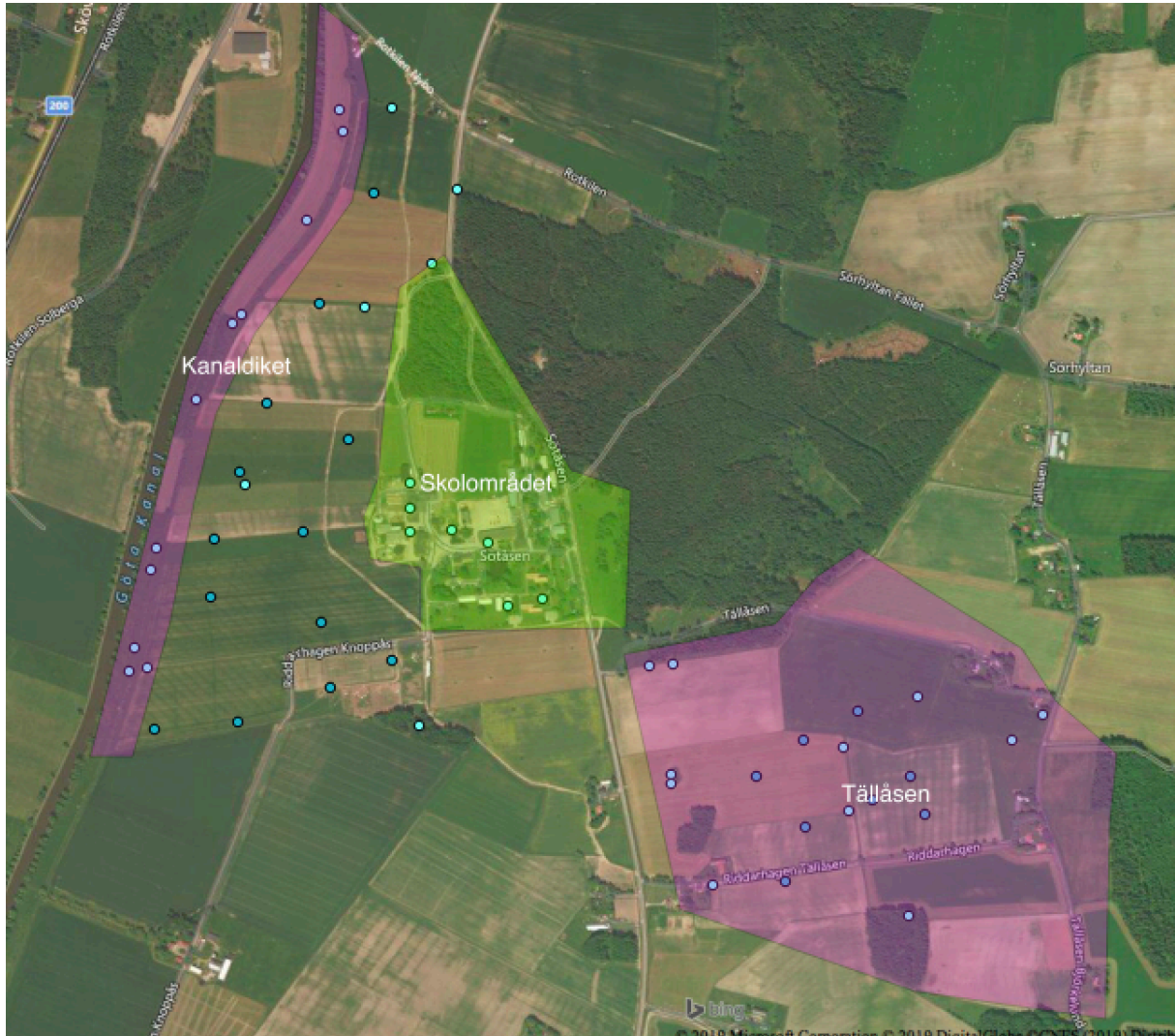
Fig 1. Biodiversity hotspots (lila områden) samt potentiell framtida hotspot (grönt område). Gränserna för områdena är inte exakta utan ungefärliga. De blå punkterna är fågelrevir för jordbruksfåglar.

mycket värdefullare än idag. Minst lika intressant är de närliggande områdena som betas, både hagmarken som är under restaurering samt betesmarken öster om vägen. Även odlingen av köksväxter, norr om skolan är ett värdefullt inslag för den biologiska mångfalden.