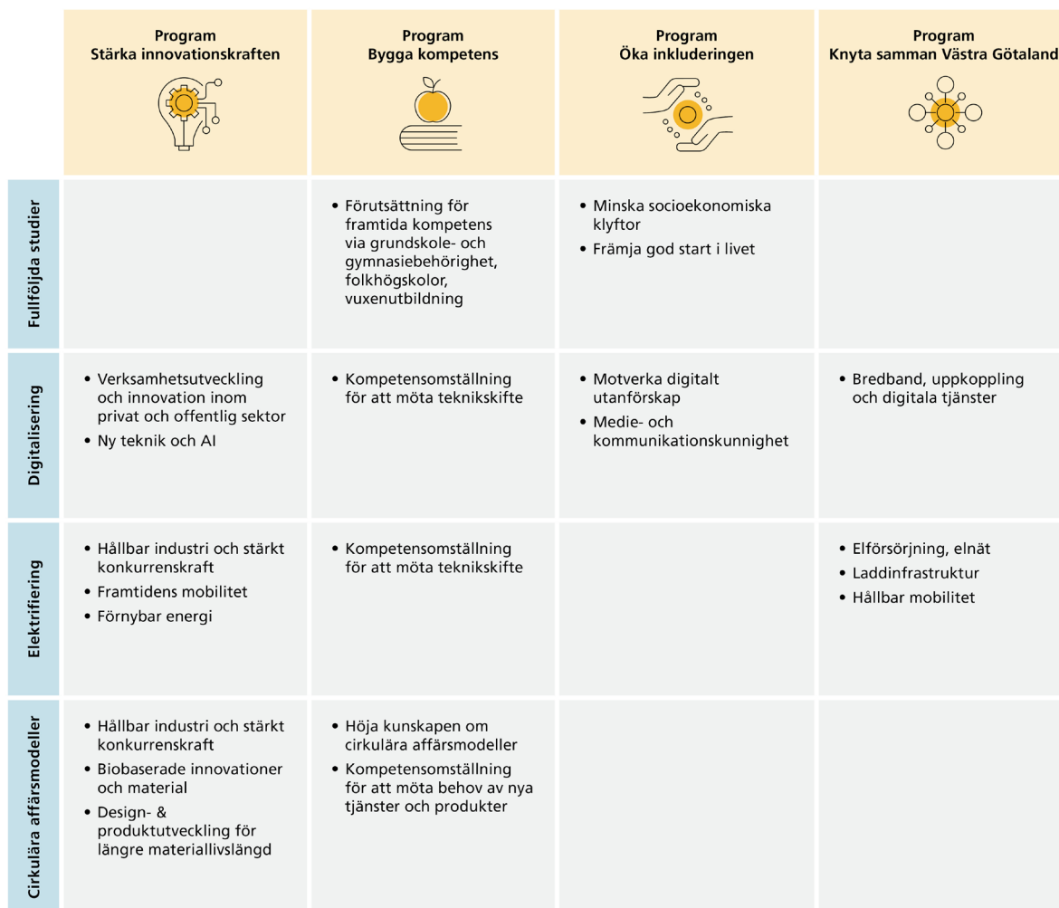
Figur 3: Figuren illustrerar hur vi kan mobilisera resurser och tillföra systemperspektiv genom att kraftsamla för Fullföljda studier, Digitalisering, Elektrifiering och Cirkulära affärsmodeller. Figuren innehåller exempel på områden inom de fyra kraftsamlingarna.

Kraftsamling Digitalisering stärker den långsiktiga prioriteringen främst genom utbyggnaden av bredband och de möjligheter som snabb uppkoppling ger. Invånare kan utnyttja digitala tjänster och vara delaktig i samhällsutvecklingen. För företag är uppkoppling idag en nödvändighet oavsett affärsmodell. Digitalisering genomsyrar alla delar av samhället och möjliggör nya sätt att organisera och göra saker på. Digitalisering underlättar delningstjänster, att koppla samman köpare och säljare samt att platser kan utvecklas utifrån sina olika förutsättningar. Elektrifiering består till stor del av digitalisering och tillämpningsområdena inom regional fysisk planering är stora.