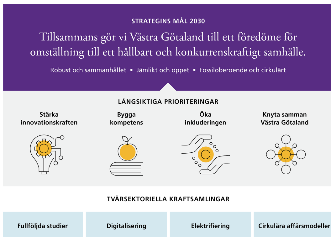
Figur 2. Den regionala utvecklingsstrategin för Västra Götaland 2021–2030 pekar ut riktningen för det gemensamma arbetet för Västra Götalands utveckling. Strategin består av ett mål, fyra långsiktiga prioriteringar och fyra tvärsektorieella kraftsamlingar.

och prioriteringar. Även beredningen för folkhälsa och social hållbarhet respektive beredningen för mänskliga rättigheter bidrar till genomförandet utifrån sina uppdrag från regionstyrelsen.