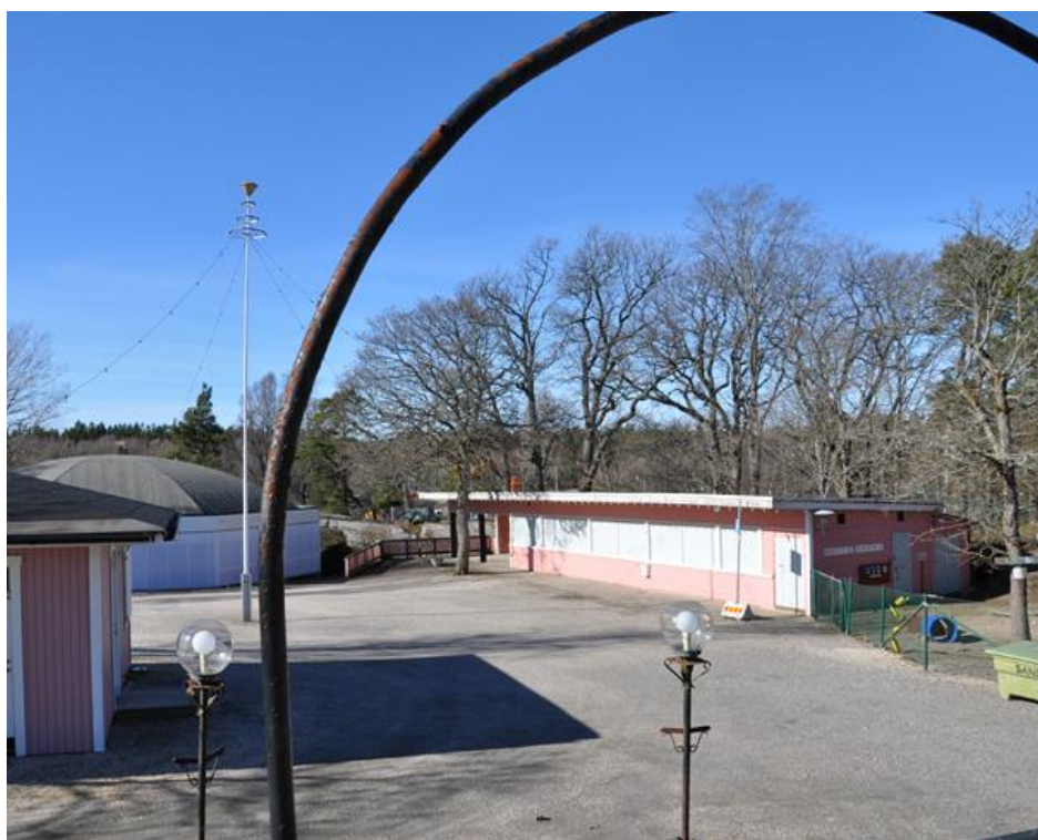
I Dalaborgsparken arrangeras sommardans

S.o.l-arrangörerna i Vänersborg arrangerar författardagar, musikcafé, loppisrundor, dansverksamhet, lovaktiviteter, teater, utställningar, musik, bygdefester, studiecirkel, föredrag, filmkvällar, dockteater, midsommarfiranden och högläsningar och man arrangerar ideellt även firande av till exempel nationaldagen. Även dessa arrangörer presenterar då och då professionell kultur genom bland annat Göteborgsoperan och filmvisningar.