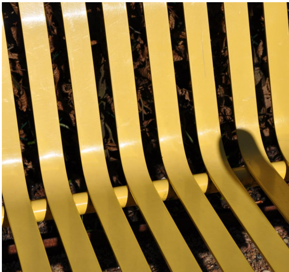
Gul bänk på torget

Det är positivt att det finns medel att söka som särskilt är vikta för att arbeta med integration och mångfald. Att de föreningar som driver integrationsarbete enbart verkar få stöd från integrationspotten men inte från grund- och riktat verksamhetsbidrag skulle dock kunna leda till en inlåsningseffekt där arbetet för integration, även om det inkluderar konstnärliga uttryck, så att säga "bara" blir en integrationsfråga.