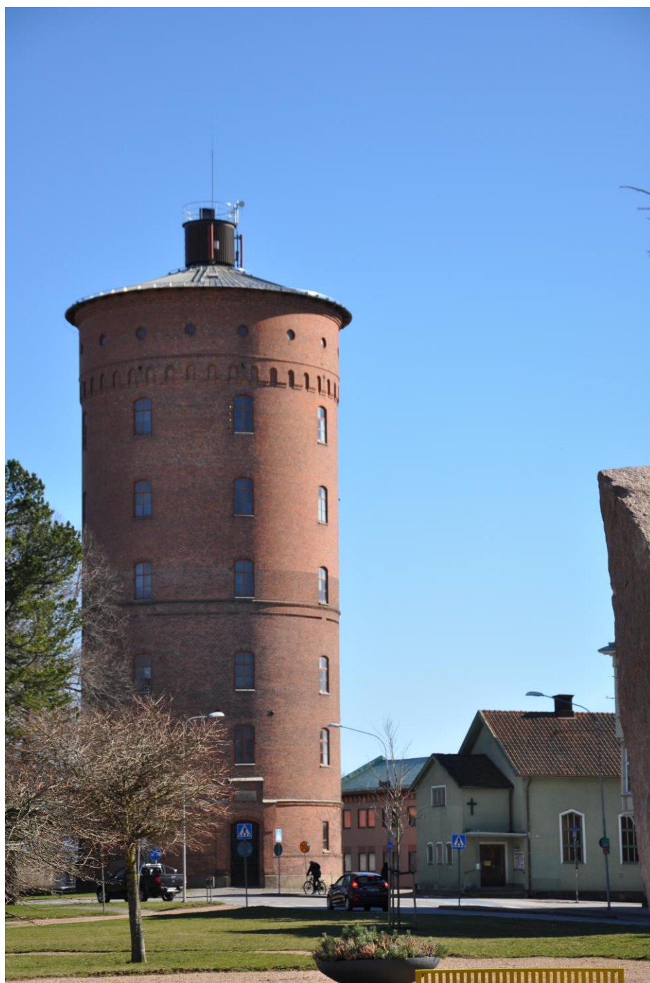
Vänersborgs gamla vattentorn

Någon uttryckte en positiv förändring med nya medier: “tidigare kom ungefär samma människor varje gång, mest äldre. Nu har det blandats upp lite mer tack vare Facebook och Visit”.