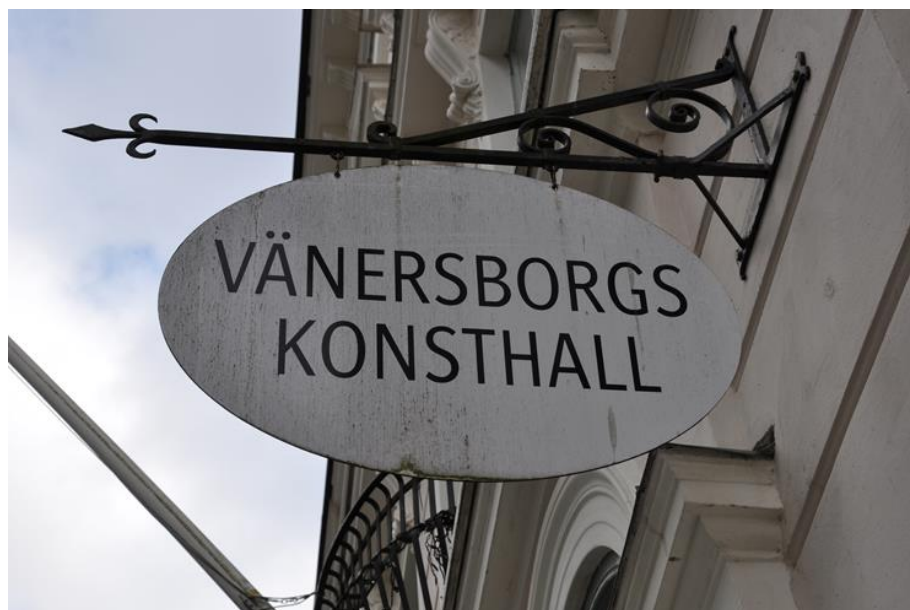
Konsthallen huserar i Folkets Hus

Biblioteken i de mindre orterna är inte de mötesplatser som centralbiblioteket är och erbjuder inte heller på samma sätt ytor för fria arrangörer att presentera kultur. Det centrala biblioteket används däremot flitigt för både kulturförvaltningens egna arrangemang, studieförbundens och de fria arrangörerna. Att se över om det finns intresse och potential för även de mindre biblioteken att utvecklas till träffpunkter kan vara ett sätt att möta den efterfrågan som vi mött i våra intervjuer kring mer kultur presenterad eller stöttad av kommunen på de mindre orterna.