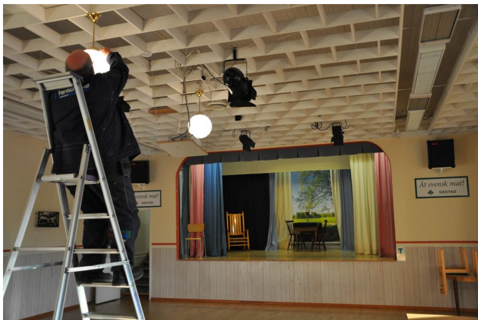
Lampbyte i Gestad Bygdegård

Se bilaga 1 Representanter vi mött, bilaga 2 Arrangörer i Vänersborg, bilaga 3 Intervjufrågor