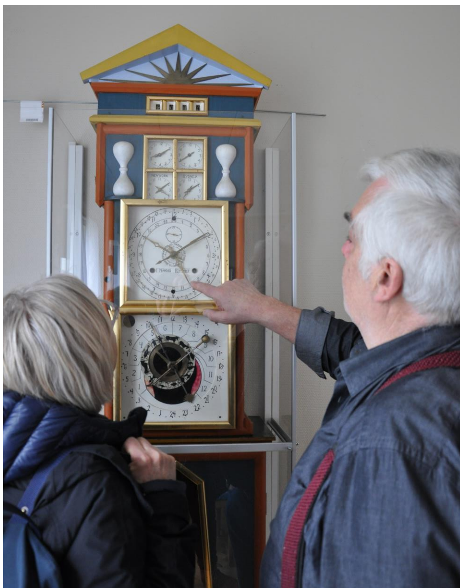
Västra Tunhems bygdegårdsordförande visar upp det unika uret

Vänersborg kan tillgodoräkna sig arbetet av nio heltidsarbetande kulturarrangörer utan att det “kostar” mer än de stöd och bidrag som arrangörer får beviljade av offentliga medel. Vänersborgs kommun är som alla andra kommuner beroende av ideella insatser om man vill kunna presentera sig som en attraktiv plats med varierat kulturutbud och vi menar att det är viktigt att dessa aspekter lyfts vid de tillfällen politiken och tjänstepersoner beslutar i ekonomiska och andra strukturer där kulturarrangörer förekommer. Utan ideella arrangörer skulle det inte vara möjligt för en kommun att genomföra starka visioner om ett kulturliv för alla.