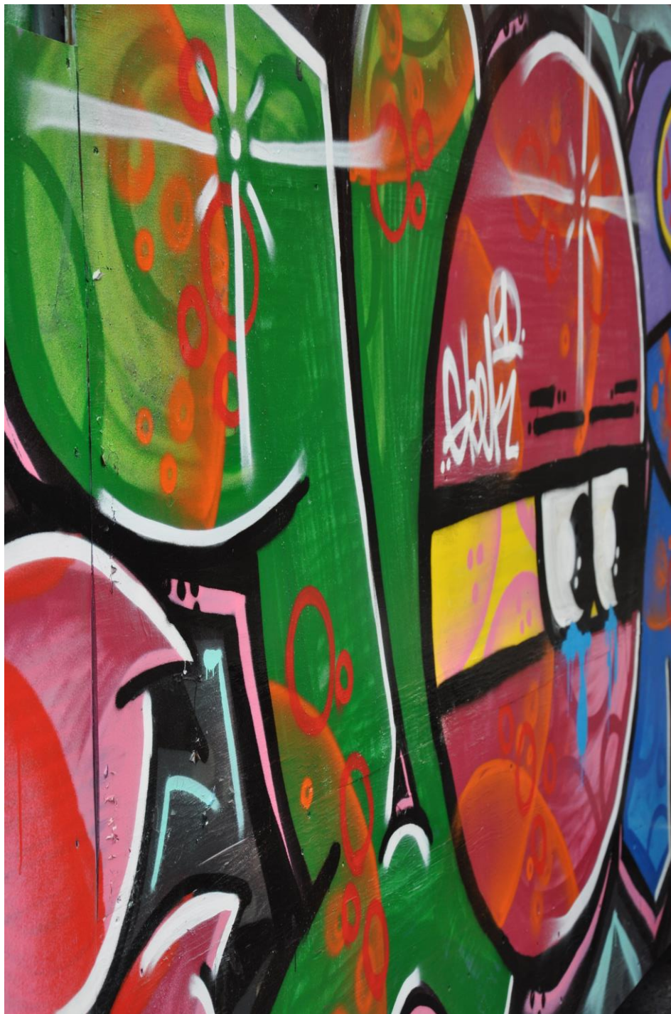
Graffiti utanför Timjans lokaler

Arrangerar brett inom kultur och folkbildning. Bland annat filmvisningar, musikal och musikföreställningar, loppis och motionsdans.