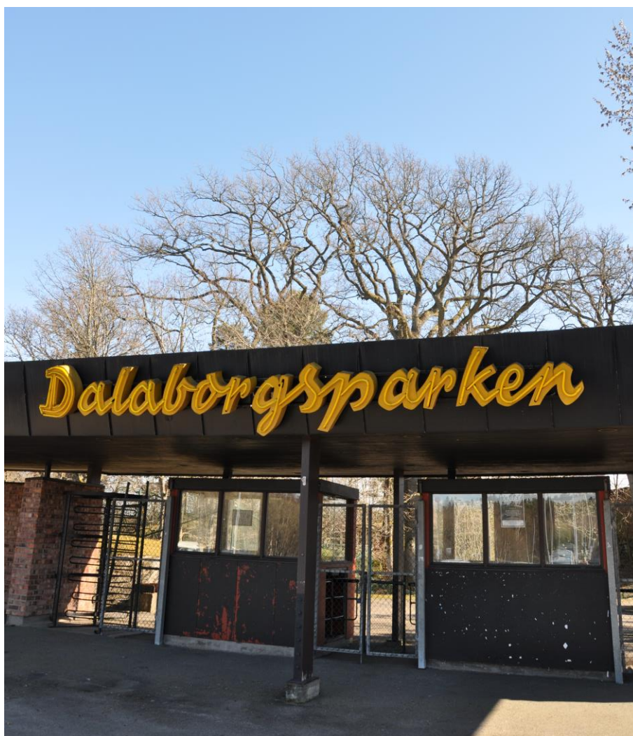
Den gamla folkparken

Att Vänersborg har som mål att vara Sveriges bästa musikkommun är tydligt uttalat och förankrat. Man gör stora satsningar på den klassiska musiken och på senare tid även på jazz. Vi kan se att det är den klassiska musiken som oftast åsyftas när man pratar om "musik" och det kan alltså sägas att den är att betrakta som norm. Detta kan riskera att osynliggöra bredden i konstarten, och strukturer och satsningar för annan musik som pop/rock/alternativ verkar också vara svagare. Om kommunen vill bli Sveriges bästa musikkommun och inte bara den bästa inom det klassiska området kan det vara av intresse att se över hur hela musikfältet främjas och därigenom öka både bredden, publiken och den allmänna förankringen för satsningen.