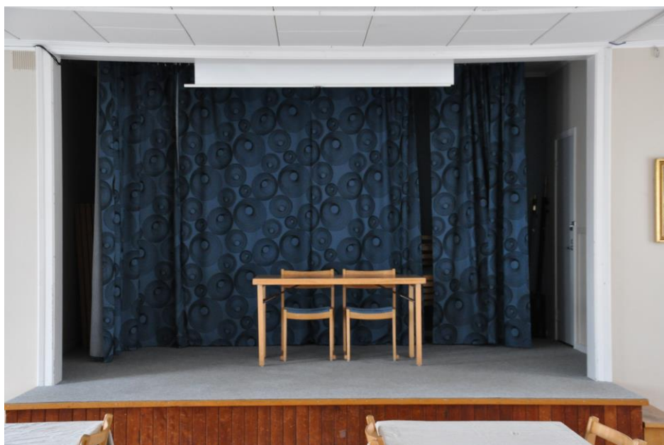
En klassisk bygdegårdsscen i Västra Tunhem riggad för styrelsemöte

I kulturförvaltningens ambition och målsättning kring den egna arrangerande verksamheten finns flera viktiga ställningstaganden man kan fundera över och en av dessa är hur mycket arbetstid man bör ägna åt arrangemang i relation till den tid och möjlighet man har att jobba strategiskt med utvecklingsfrågor och främjande verksamhet. Detta är en diskussion som kan leda till att förvaltningen arrangerar mindre, mer eller annat utbud men som bidrar till en medvetenhet kring valen man gör som kommun med de dubbla rollerna; att presentera kultur för invånarna men också att främja och stötta andra aktörer som presenterar kultur.