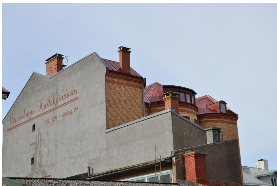
Minnen på en husvägg