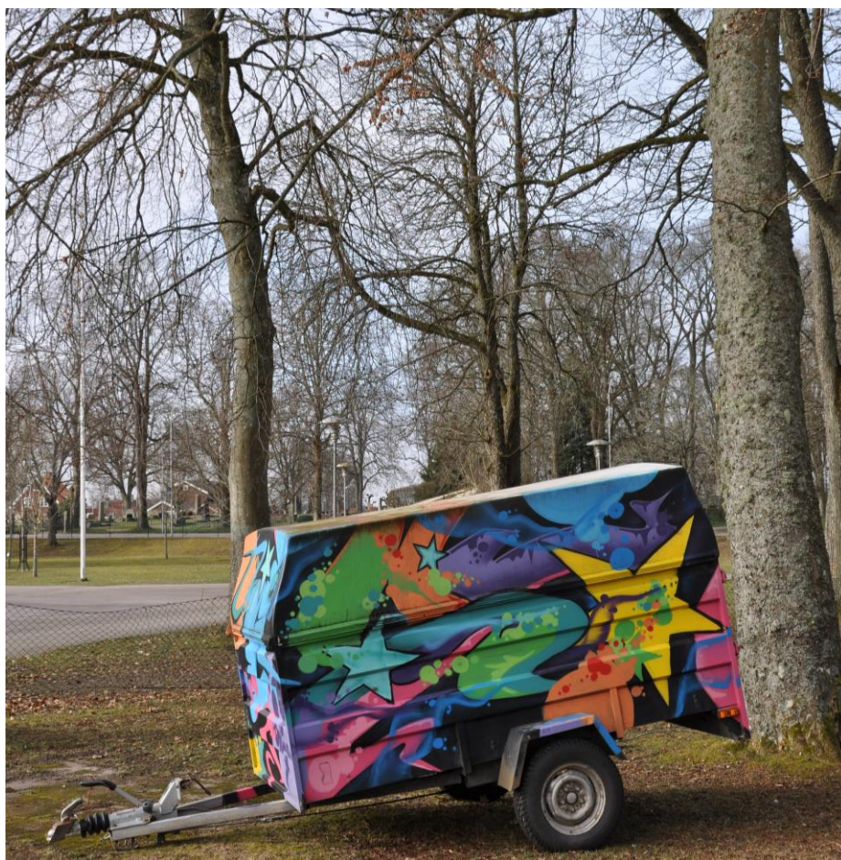
Utanför Timjans lokal i Vänersborg

Kultur i Väst är en av Västra Götalandsregionens två kulturförvaltningar och erbjuder insatser i form av rådgivning, handledning och inspiration för kommuner och kulturaktörer genom exempelvis fortbildning, kurser, konferenser och utvecklingsprojekt.