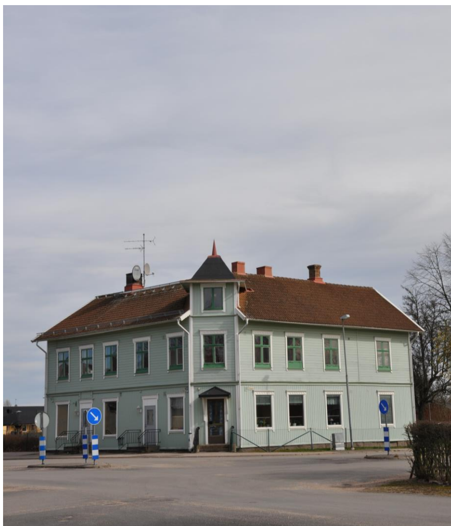
Ståtligt hörnhus i Brålanda

Om vi ska prata om vad vi vet om publiken i Vänersborg får vi fokusera mer på det som inte sägs än det som faktiskt uttrycks av arrangörerna. Vi kan konstatera att ytterst få informanter hänvisade till faktisk kunskap om publiken. Och det är oftast så det ser ut - man gör antaganden kring vilka människor som besökt ens arrangemang och utgår från dem när man talar om "sin publik".