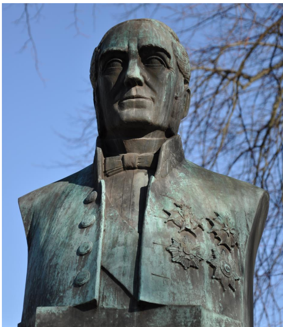
Byst av Erik Josias Sparre

Omkring ett år efter att Kultur i Väst överlämnat rapporten återkommer vi för att göra en utvärdering av effekter av Arrangörslyftet.