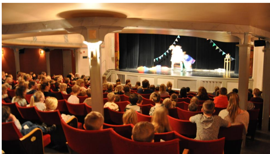
Skrattande skolpublik på Vänersborgs Teater

Vi kan konstatera att det finns ideella aktörer inom flera konstarter; film, konst, teater och olika musikgenrer. Vi reflekterar dock över avsaknaden av individuella arrangörer, enskilda eldsjälar och andra som arrangerar i andra former än de traditionella föreningsstrukturerna. Det kan ofta vara ungt engagemang i mer tillfälliga sammanslutningar som av olika orsaker väljer bort de traditionella systemen. Dessa arrangörer har en förmåga att locka ny publik genom att erbjuda utbud till grupper som inte identifierar sig, vare sig ålders- eller intressebaserat, med det utbud som annars presenterats. För att ha en möjlighet att stötta denna form av arrangörskap vill vi framhålla vikten av att man, redan innan efterfrågan väcks, samtalar kring hur den ska hanteras inom kommunens stödsystem. Om kulturförvaltningen vill kunna skapa eller möta en sådan efterfrågan är det bra att ha principer på plats.