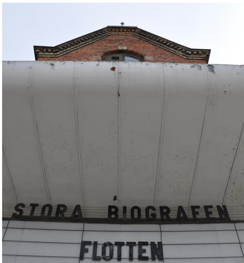
Stora biografen där Vänersborgs filmstudio visar film

Målsättning: Dialogen mellan arrangör och kommun breddas och inkluderar fler aktörer. Arrangörer som deltar på träffar får möta andra arrangörer med liknande förutsättningar och behov.