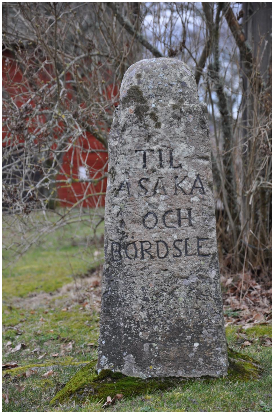
Utanför Västra Tunhems hembygdsgård