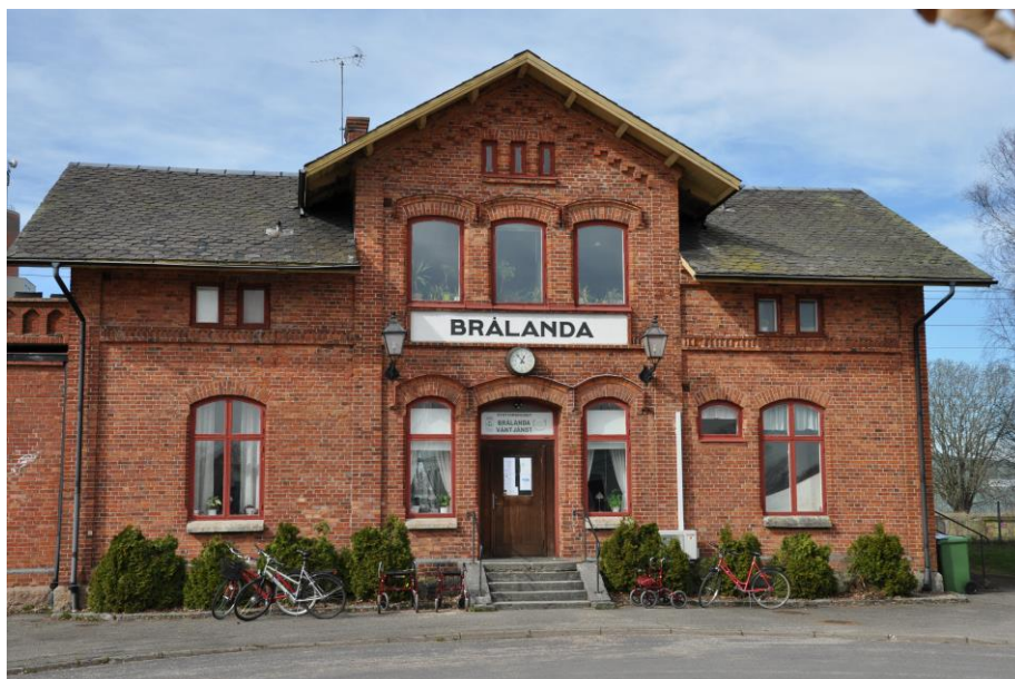
Brålanda väntjänst samverkar med många lokala aktörer

Vi hör liknande resonemang från andra arrangörer som säger: “Det är svårt med politiken. Positivt bemötande från tjänstepersoner med sedan tar det stopp”, “Det finns mycket vilja och önskan om att föra dialog och så, men det blir sällan av, det blir en tummetott” och “det blir krånglig på vägen, mer rörigt än byråkratiskt”, “hur ser deras interna struktur ut, kanske osäkra mandat som skapar oro hos oss andra?” samt “det verkar inte finnas en utstakad riktning och tydlig vision - kanske saknas kulturplan?”. Till slut kommer det ett även konkret önskemål som svar på frågan om samverkan med kulturförvaltningen: “Varför har inte Vänersborgs kommun en 24-timmarspolicy på att svara på mail? Man skulle iallafall önska att man får någon form av livstecken, återkoppling!”