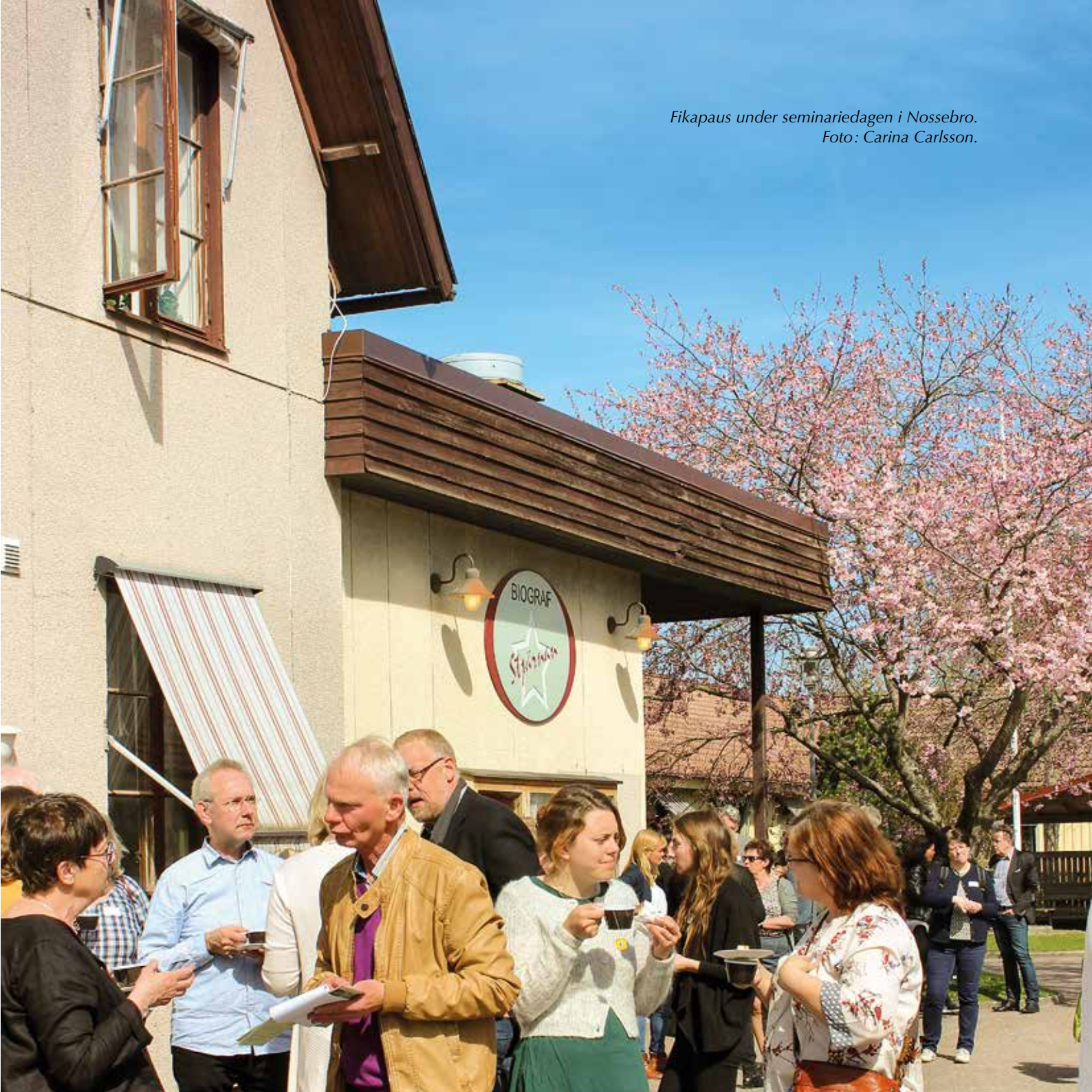
Fikapaus under seminariedagen i Nossebro.