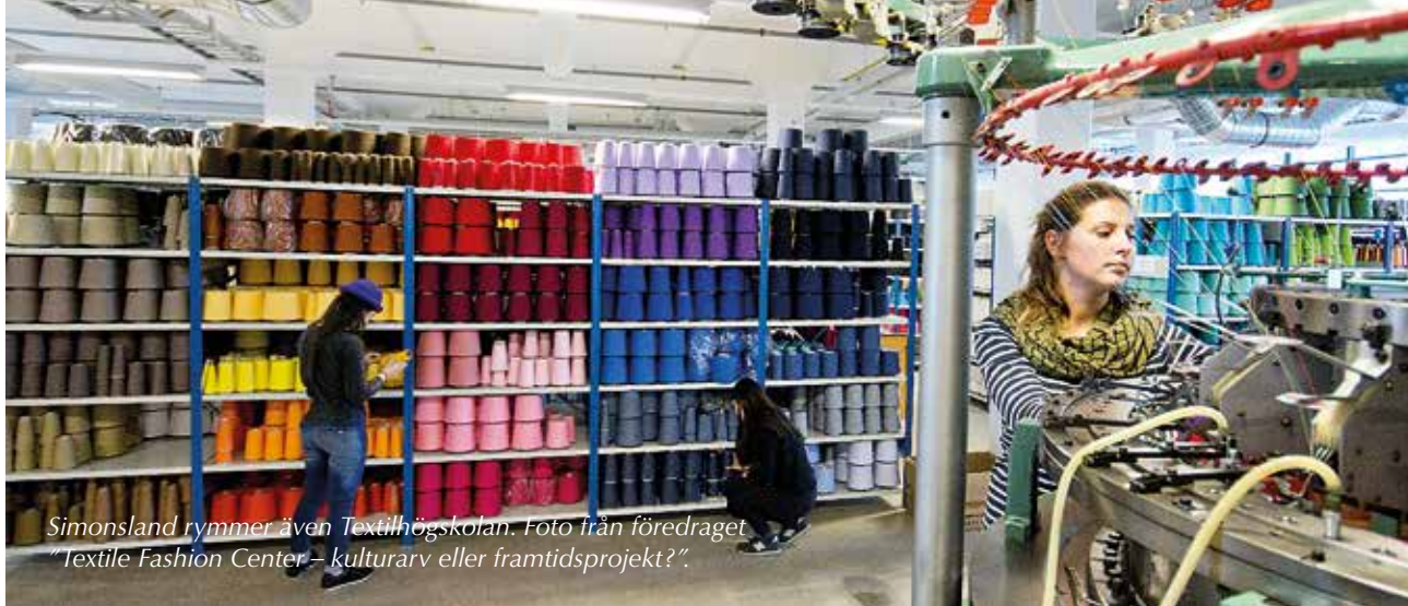
Simonsland rymmer även Textilhögskolan. Foto från föredraget "Textile Fashion Center – kulturarv eller framtidsprojekt?".