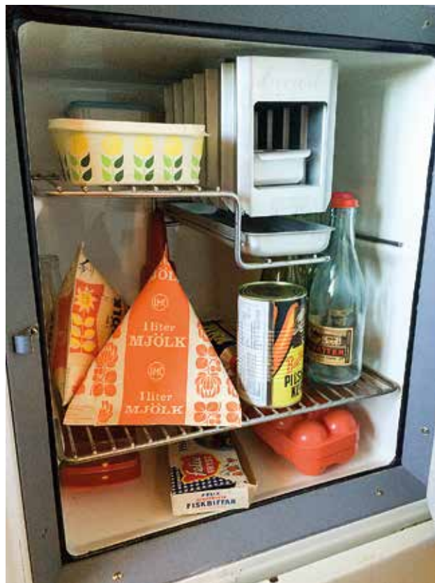
Retro väcker nostalgi och minnen.

Omvärlden intresserar sig också för skandinaviskt retro. I Japan kan man se det både här och där och det finns butiker ända bort i Nya Zeeland som vill köpa in retro härifrån. Omvärlden har länge gillat vår formgivning. På Parisutställningen 1925 (där fokus låg på arkitektur, interiörer och konst) innebar det svenska deltagandet i utställningen betydande framgångar med 36 medaljer. Och Stockholmsutställningen 1930 omvände Stockholms byggare och arkitekter i ett svep till en ny estetik som i Sverige fick namnet funktionalism. Att vi var förskonade från andra världskriget betydde också att vi både kunde producera och köpa formgivna saker. Så efter kriget utvecklades den skandinaviska stilen ytterligare, bland annat användes mycket trä, och väckte intresse internationellt.