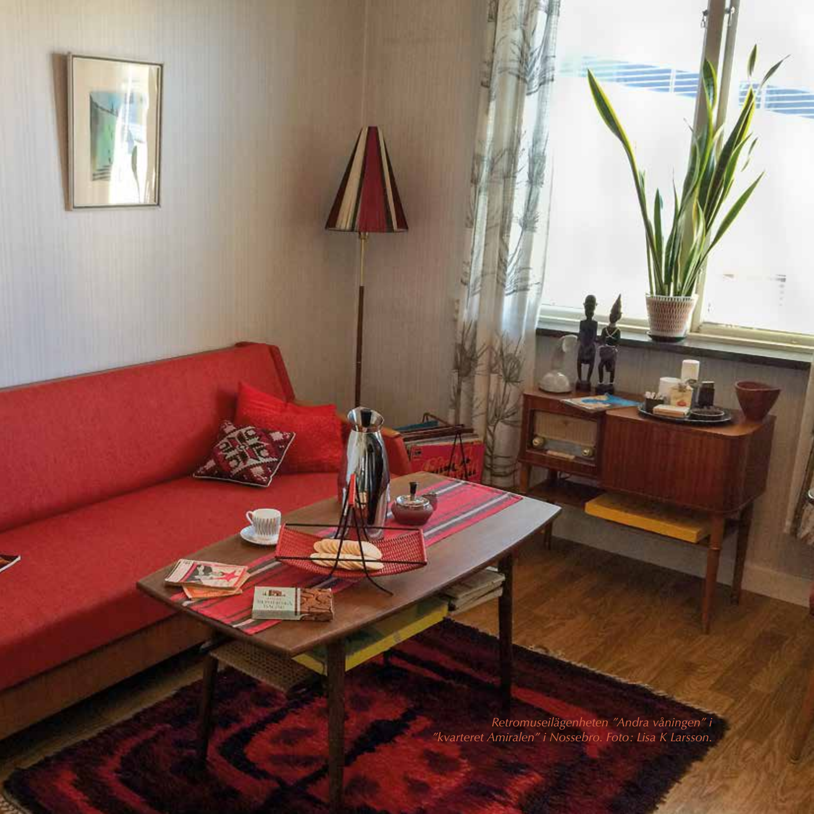
Retromuseilägenheten "Andra våningen" i "kvarteret Amiralen" i Nossebro.