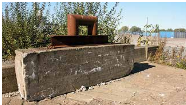
Äldre och yngre foton från Frihamnen på detta uppslag från föredraget "Göteborgs Frihamn – ett nytt sätt att planera en stad".

byggnadsdetaljer eftersom man måste höja marknivån på hela området på grund av översvämningsrisken. Detaljerna kommer därmed kanske inte att kunna bevaras på ursprunglig plats, "in situ".