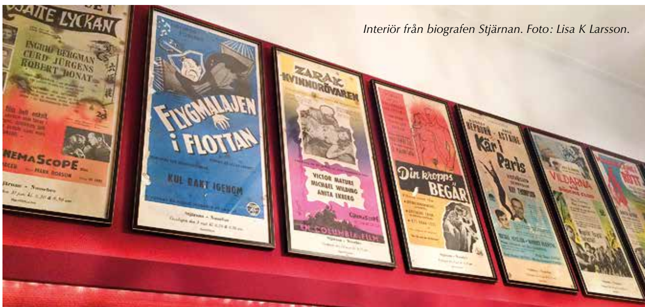
Interiör från biografen Stjärnan.

Kan man då leva på retro? Ja, det kan man. På flera olika sätt. Man kan sälja saker på loppisar, man kan göra tidningar, man kan ordna årliga marknader i ”retrosamhällen”. Men att gräva där man står bidrar också till annan utveckling, bland annat i besöksnäringen. Och det har man gjort i Nossebro. Man har tittat på