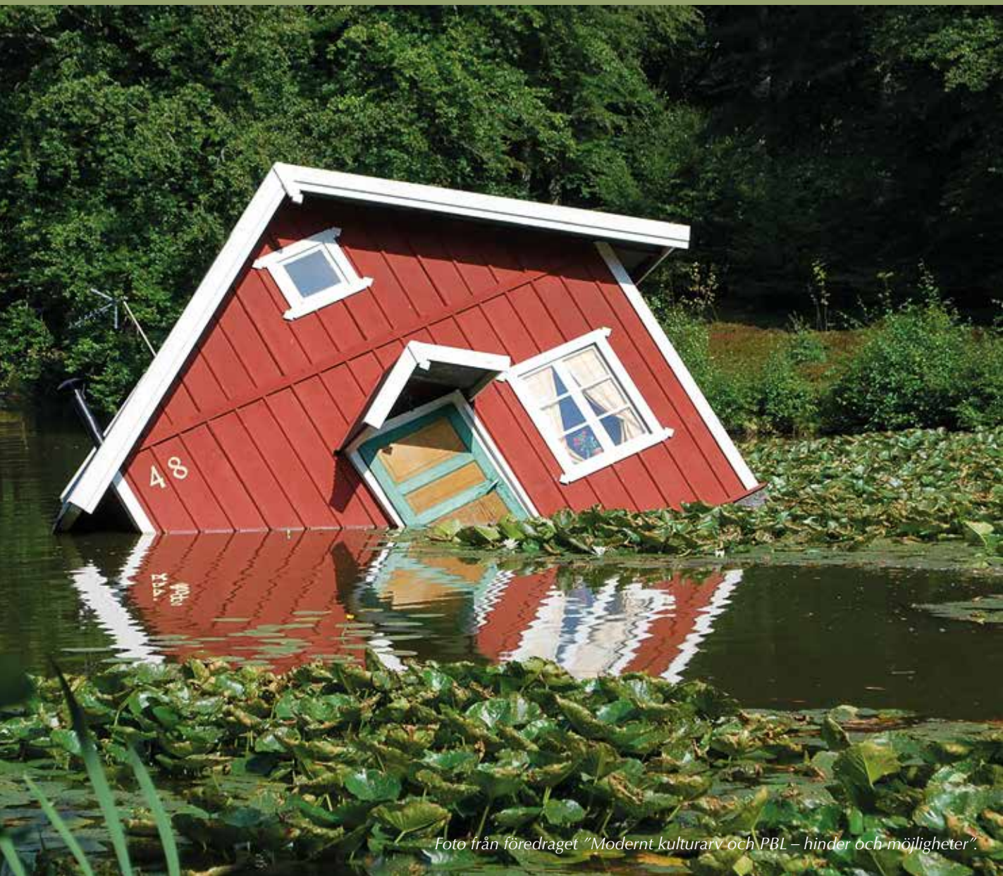
Foto från föredraget "Modernt kulturarv och PBL – hinder och möjligheter".