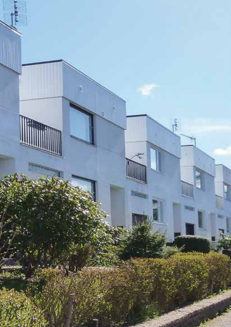
Foton och bild detta uppslag Astrid Bäckman, från föredraget "Modernt kulturarv i kommunala planeringsunderlag – exemplet Trollhättan".