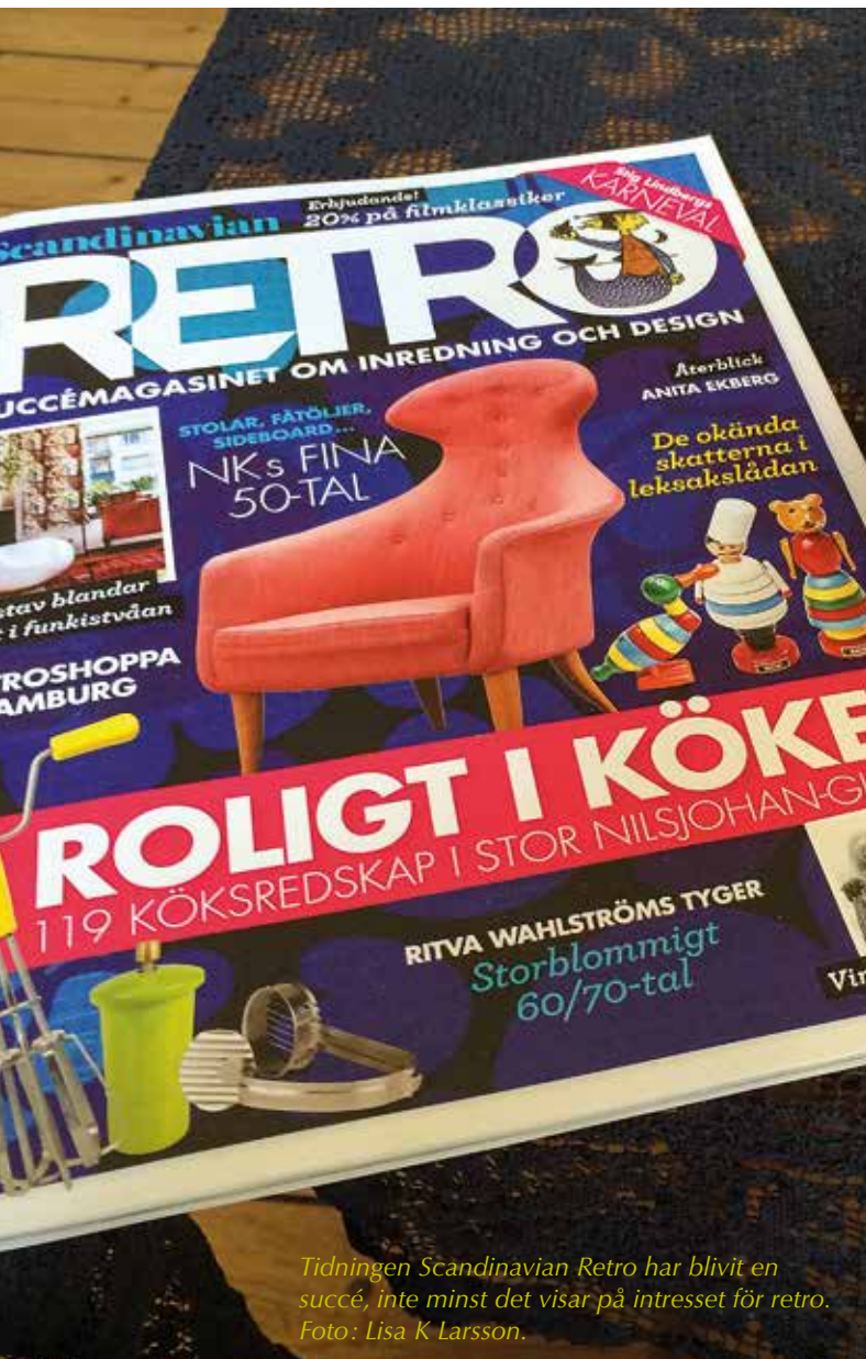
Tidningen Scandinavian Retro har blivit en succé, inte minst det visar på intresset för retro.