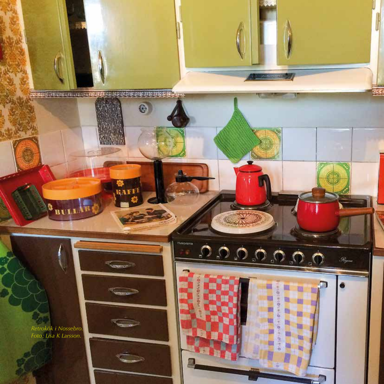
Retrokök i Nossebro.