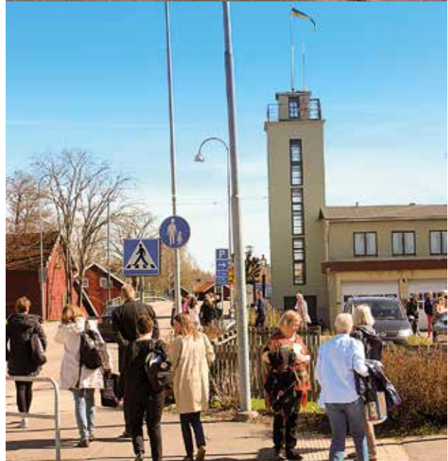
Amiralen då (foto från föredraget "Kan man leva på retro?") och nu (foto Carina Carlsson). Övriga foton och bilder detta uppslag från föredraget "Kan man leva på retro?".