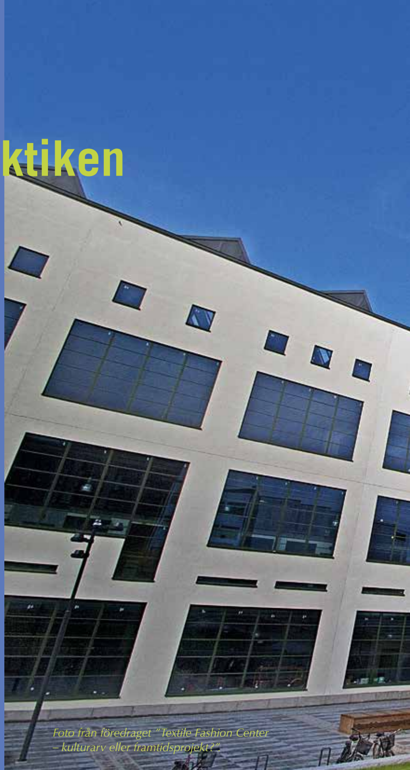
Foto från föredraget "Textile Fashion Center – kulturarv eller framtidsprojekt?"