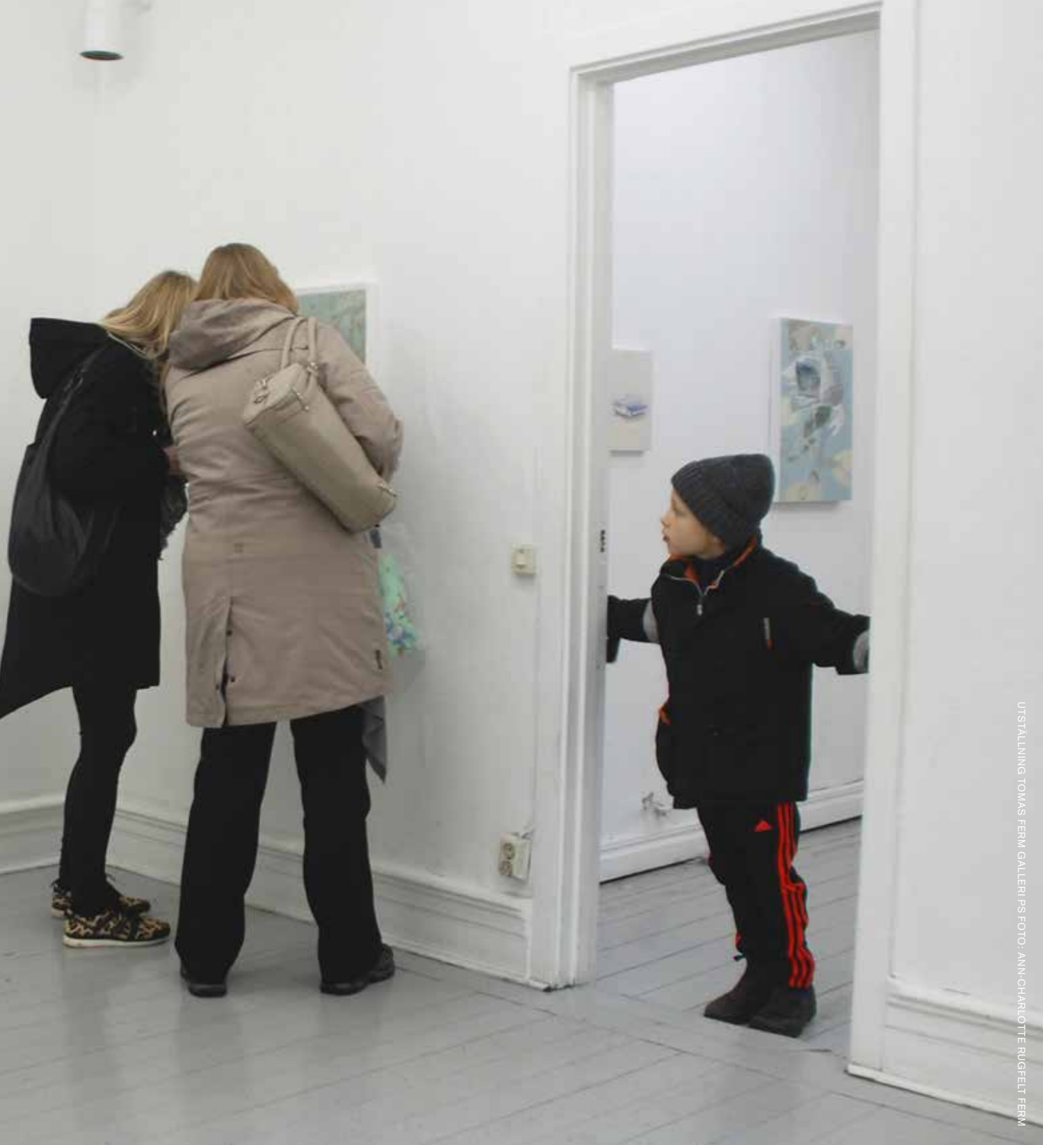
UTSTÄLLNING TOMAS FERM GALLERI PS