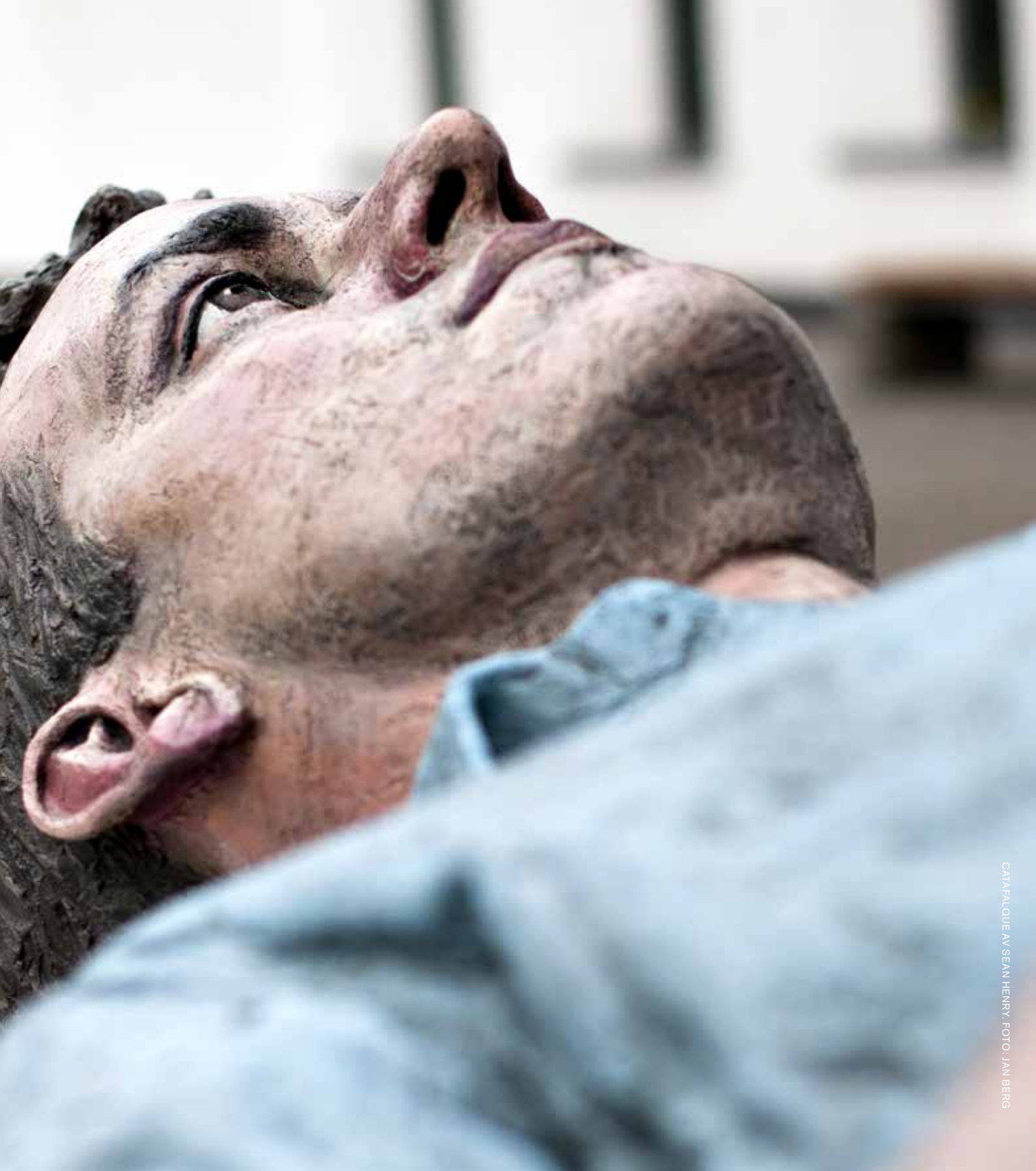
CATAPALQUE AV SEAN HENRY.