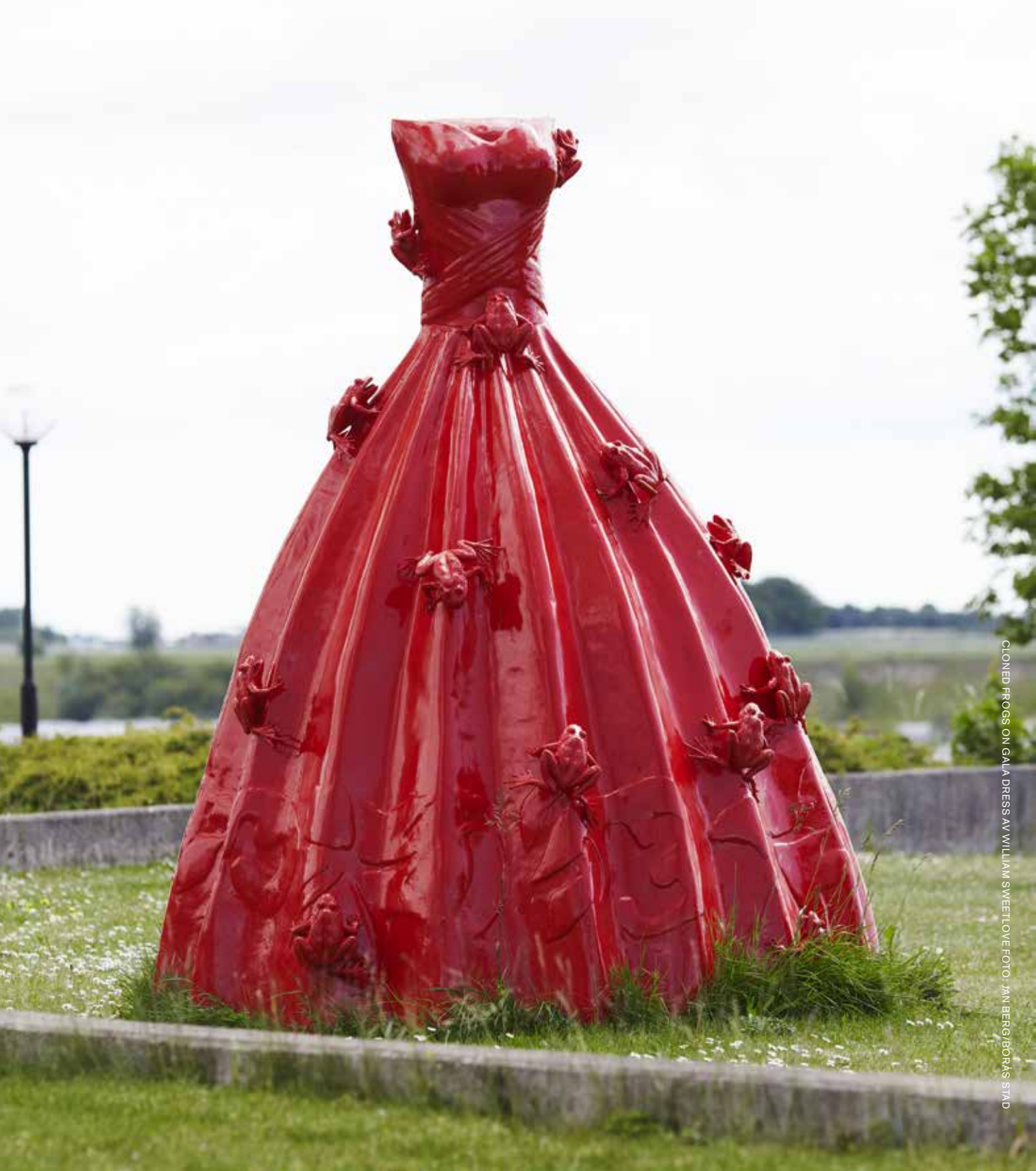
CLONED FROGS ON GALA DRESS AV WILLIAM SWEETLOVE