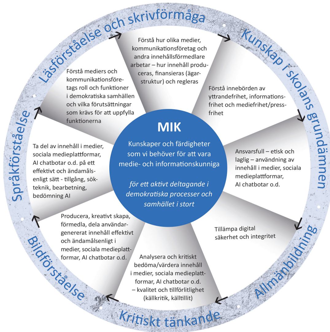
Figur 2. MIK: Kunskaper och färdigheter, individnivå (Carlsson uppdatering juni 2023)

MIK befinner sig i en process där förändringar oavbrutet pågår i samhället, teknologin och medierna. Det är ett begrepp i rörelse globalt, i Europa, nationellt, regionalt och lokalt. Det finns dock en rad element i MIK-begreppet som består över tid även om teknologikutvecklingen kräver vissa modifikationer och omprövningar.