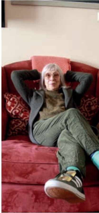
I barnens tjänst Suzanne Osten har ägnat nästan hela sin karriär åt att göra konst för barn och om barndomen för vuxna.

att teater för barn kan vara absolut livsavgörande och trots att få barn och unga i dag får ta del av konst och kultur, så är det förhållandevis många som vill spela teater och bli skådespelare.