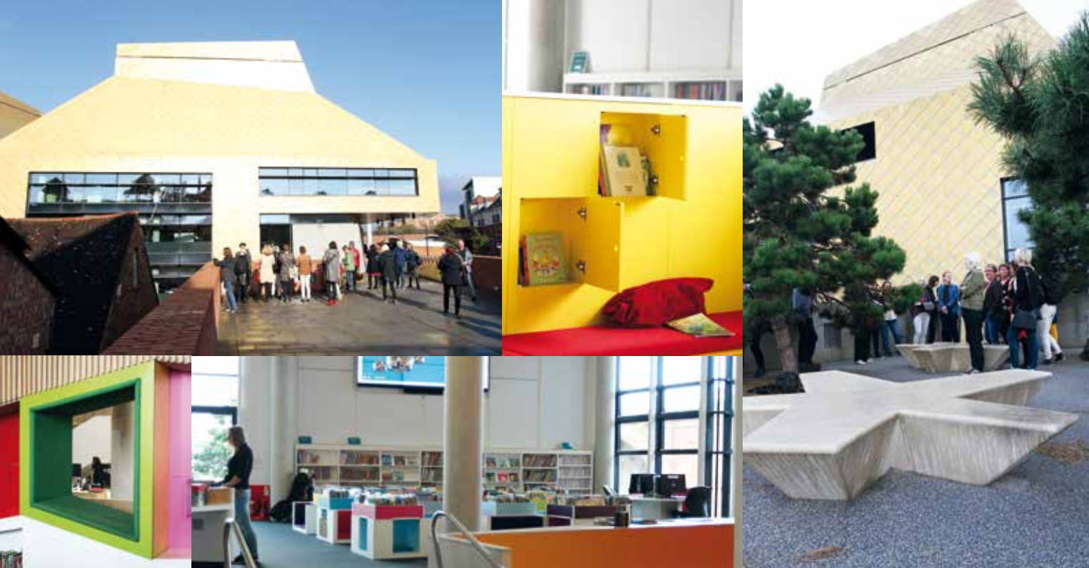
Bikupan I Worcester ligger biblioteket The Hive, som är ett kombinerat folk- och universitetsbibliotek. Här finns också en av de största barnavdelningarna i Storbritannien, med både digital teknik och en terrass för sagostunder. Personalen har ingen inre tjänst och allt planeringsarbete sker på stående fot.