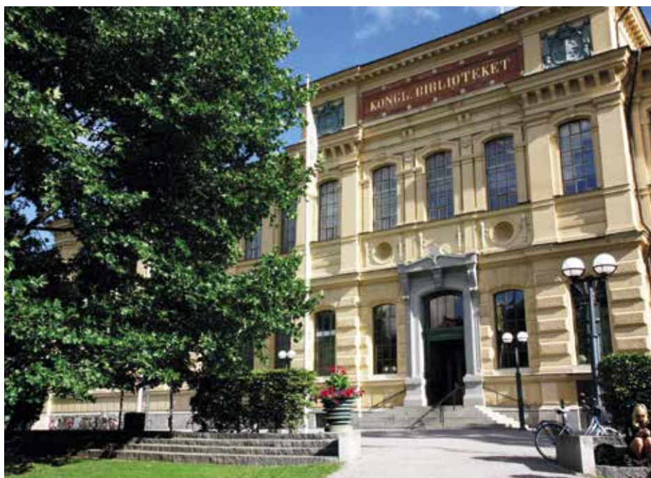
Myndighetsinstruktion Regeringen har utsett Kungliga biblioteket att ha ett samlat ansvar för bibliotekssektorn i hela Sverige.