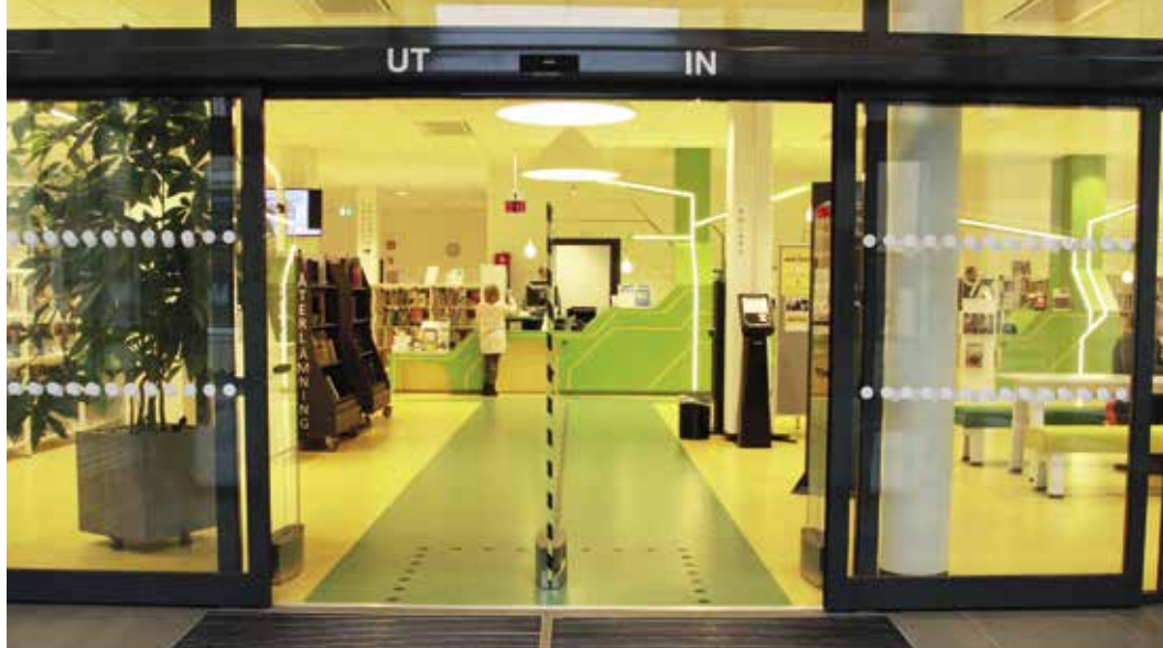
Reviderad biblioteksplan Bibliotekschef Tobias Bengtsson vill revidera Lidköping kommuns biblioteksplan för att säkra bibliotekets nya roll i Lidköping.

Den biblioteksplan som finns i Lidköping är från 2009 och kom till under en period när en stark opinion drev fram en folkomröstning som handlade om var ett nytt bibliotek skulle ligga. Tobias tror inte att biblioteksplanen användes som dokument under den processen, men att den ändå spelade roll i sammanhanget eftersom det gjorde bibli-