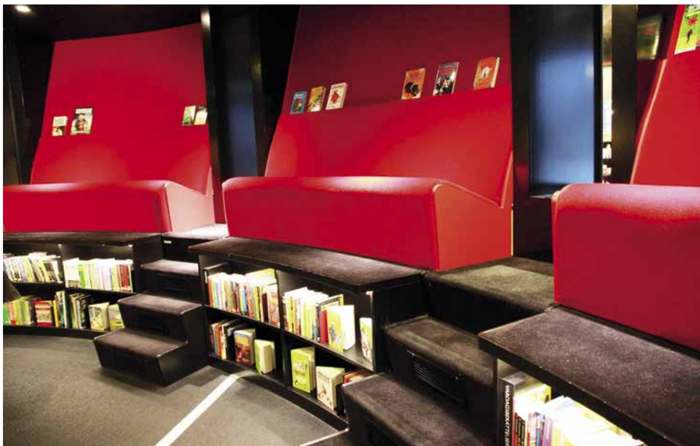
Aktivt häng På barnbiblioteket TioTretton i Stockholm går det att laga mat, göra musik, pyssla, spela teater, lösa en bok. Eller bara vara.

och där ingen i personalen är utbildad bibliotekarie.