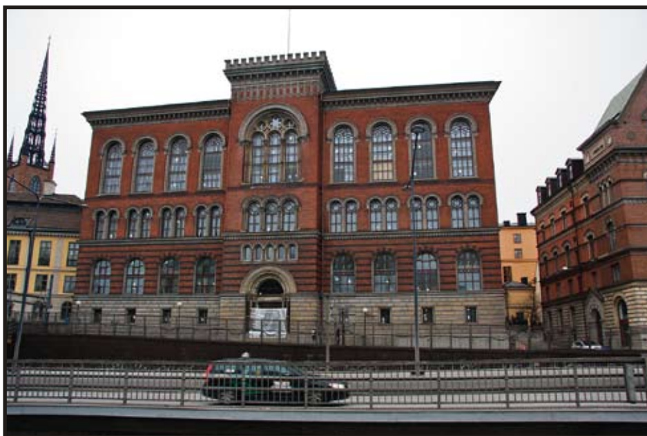
Kulturhus för unga. Trafiken dundrar förbi i en tät ström framför den pampiga byggnaden som till hösten kommer att slå upp portarna till Palatset. Husets entré kommer att vara på baksidan av huset.