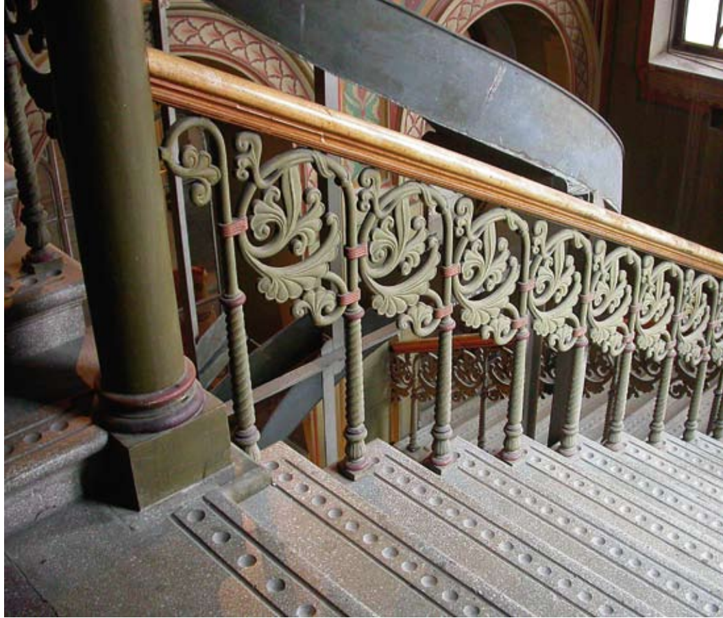
Magisk värld. Palatset ska vara inflyttningsklart till hösten och i början kommer verksamheten att fokusera på helger och familjer med barn och vuxna.

Varje vuxen på Palatset har också ett barn som mentor och det har till och med skrivits en konkret handbok för de vuxna som ska jobba med barnen.