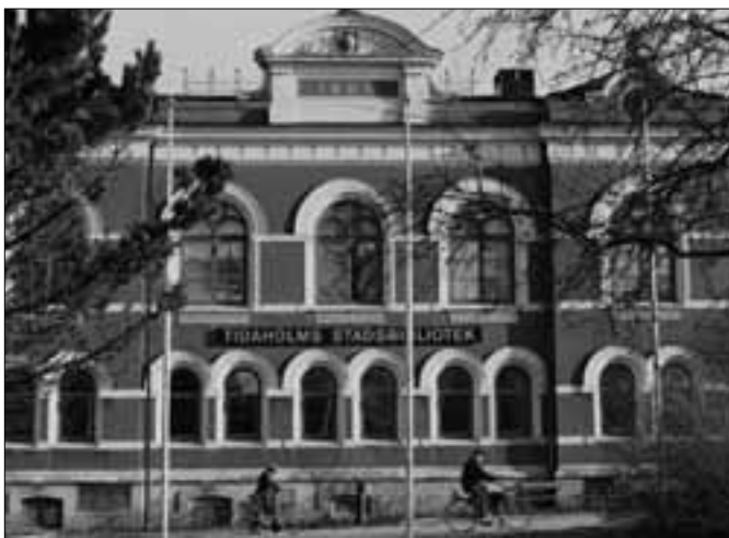
Vulcans biblioteks- och skolhus byggdes åt fabriken anställda i slutet av 1800-talet. Huset togs efterhand över av kommunen och köptes slutligen för en krona 1980.