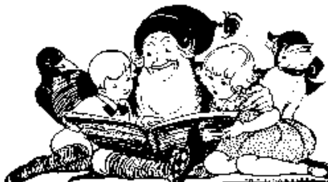
Ur Nu är det Jul igen , 1930

Som avslutning bara ett litet citat - ”Den som slutar att bli bättre är snart inte längre bra”. En tuff men kanske ändå så viktig insikt.