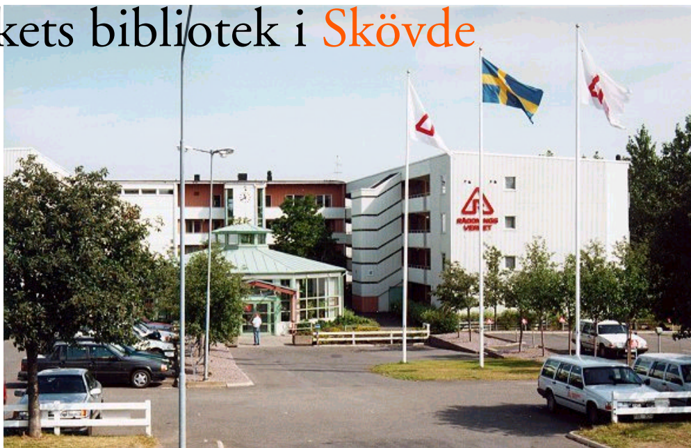
Räddningsverket i Skövde

Sammanlagt är vi ca 120 anställda och drygt 30 av dessa arbetar på vårt stora övningsfält i Hasslum. Lärarna dominerar förstås men här finns också servicepersonal, administratörer, informatör, IT-personal, m fl. En stor och spännande arbetsplats med andra ord! Skolan är belägen i Södra Ryds centrum. Många som går förbi har ingen aning om all den verksamhet som försiggår här! Aulan används även av utomstående (läs: kommuner och landsting) för föredrag och liknande.