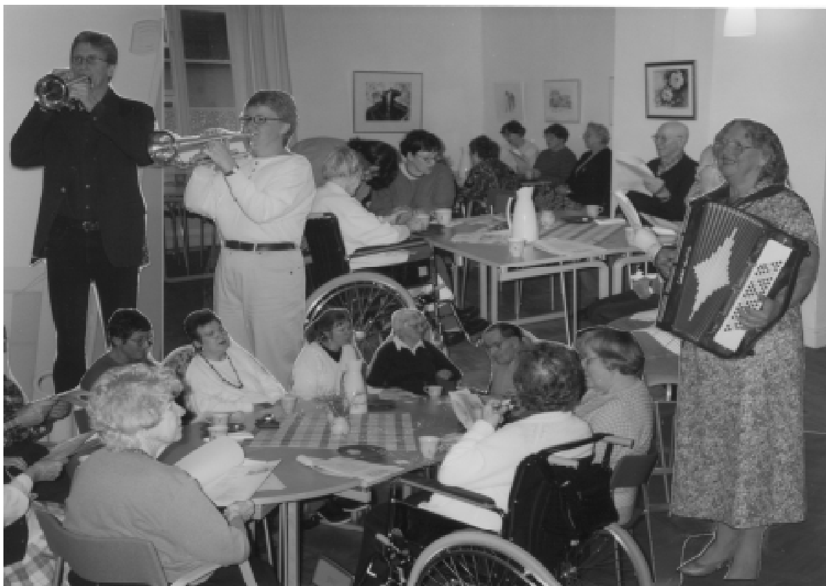
På måndagar är det musikcafé i Herrljunga