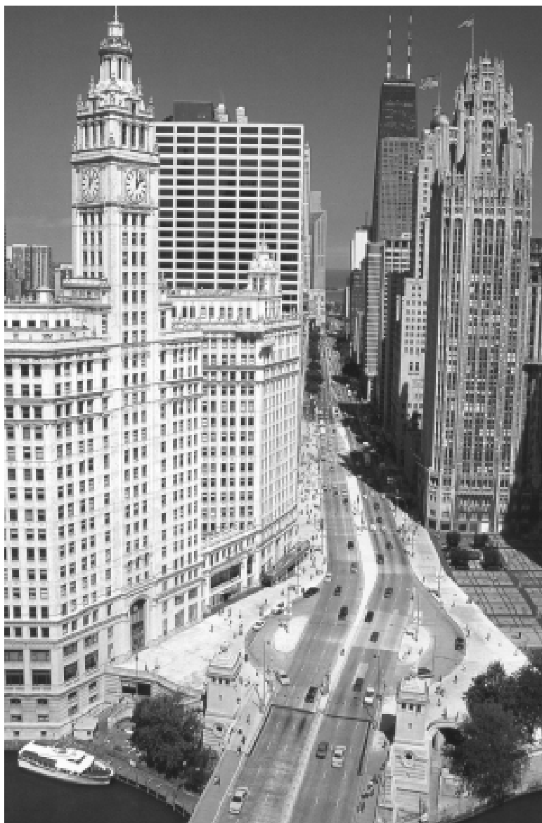
Michigan Avenue, "The Magnificent mile." Chicago