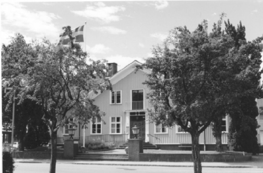
SVENLJUNGA BIBLIOTEK SOM 1852 BYGGDES SOM TINGSHUS

”Suckarnas gång”, den underjordiska passagen mellan biblioteket (som byggdes 1852 som tingshus) och fängelset, för att väl på plats i en av de gamla cellerna få lyssna till högläsning. I samband med sagostunden eller tillsammans med sin dagisgrupp får barnen visning av biblioteket och får också låna böcker. Barn från skolans 6-årsverksamhet får med sig ett förbindelsekort hem, som skall fyllas i och skrivas under av målsman. När detta är gjort får barnen egna lånekort, vilket sker i samband med en introduktion om biblioteket, böcker och hantering av media.