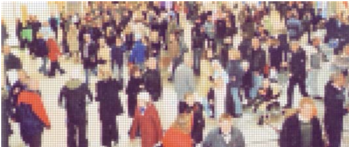
Biblioteken i Västra Götaland presenterar anpassade medier på utställningen OrdetÄrDitt.nu i Nordstan 24-27 september.

satsat på reklamslag i Radio City 107,3. Även i år blir det under samma vecka som Bok & Bibliotek men vi startar och slutar en dag före dem, alltså 24-27 september.