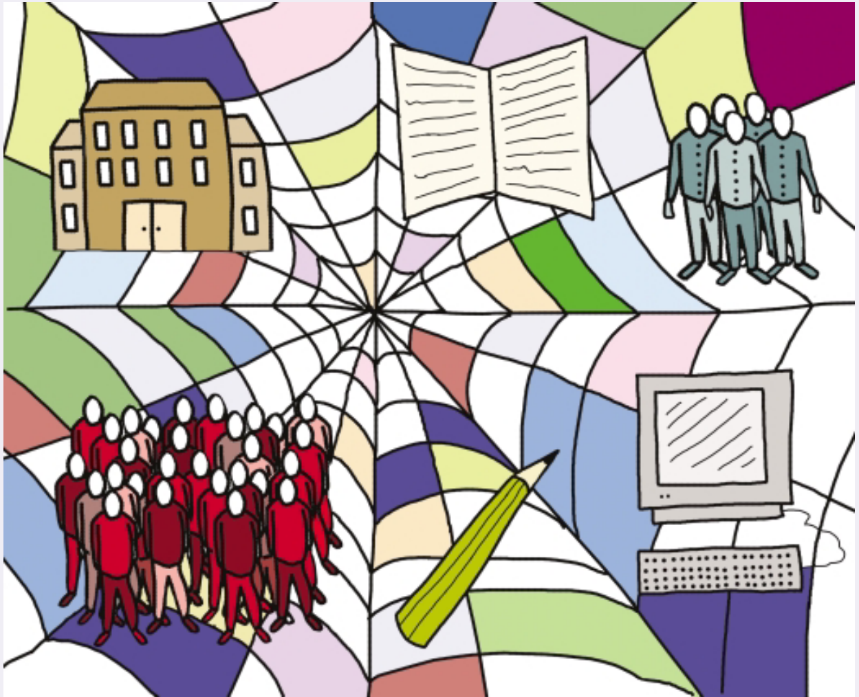
Illustration: Oskar Ferm