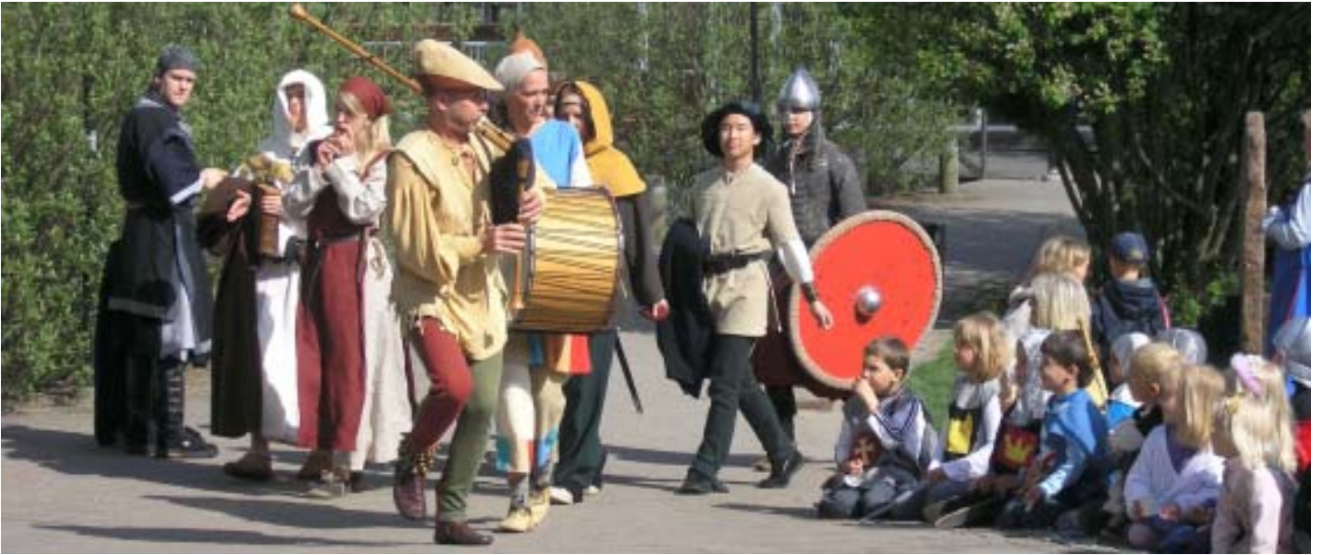
I Stenungsund lyckas man tack vare samarbete på Kulturhuset Fregatten anordna temadagar för barn.