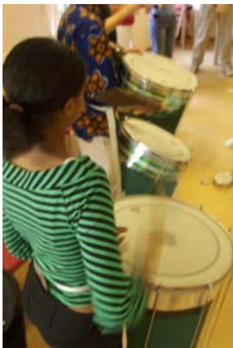
Det var mycket musik och dans på kulturlägre som anordnades för barn och ungdomar från flyktingboenden i regionen.