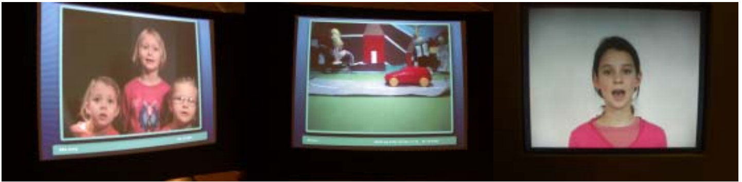
Filmboxen på Fredrikshamns bibliotek, där man kan spela in sina egna tips, är lika populär bland 3-åringar som 18-åringar. I Animationsmaskinen kan man skapa egna filmer som liksom tipsen visas på en stor filmduk i Det Runde Rum.