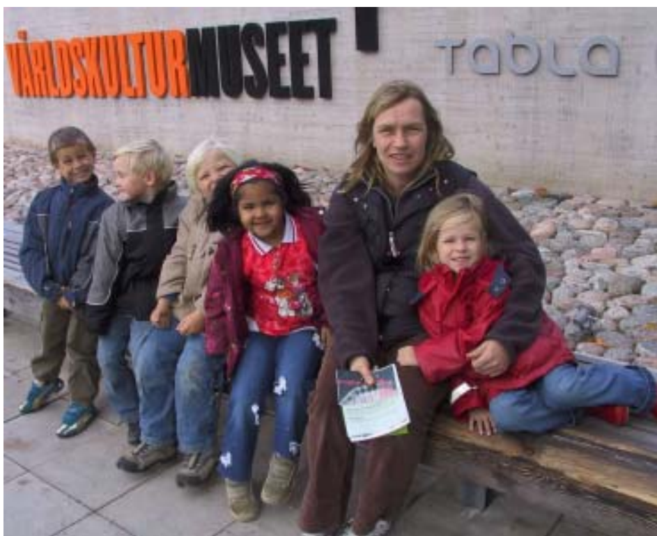
Barn och personal från Katrinbergs förskola.

Vi gick runt i hela huset och till sist samlades vi åter på de rosa kuddarna och alla fick välja ut sitt favoritställe, nåt extra vackert, häftigt, spännande.