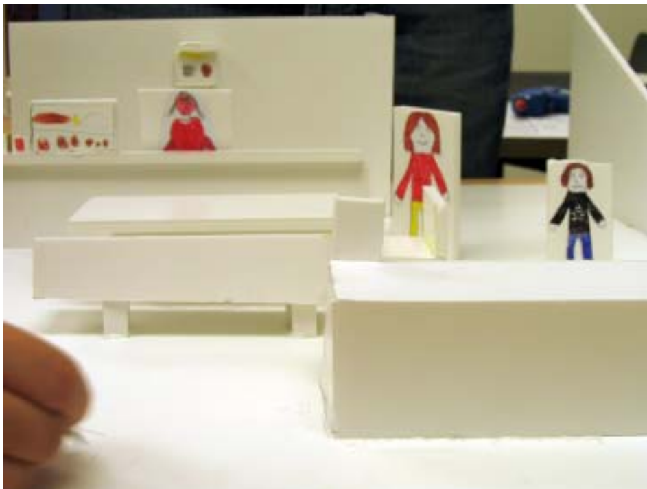
”Man är den där lilla figuren som man satt dit vid utlåningsdisken.”

Stöpeneleverna var i en ålder då man börjar åka lite längre från hemmet och sikter ligger på att bli vuxen. Vi undrade hur stadsbiblioteket kunde bli när dom själva blivit äldre, kanske tjugo år sådär. Här utgick vi från vad man fick och inte fick göra på biblioteket. Elevernas utsagor handlade mycket om att man inte fick prata, och gjorde därför flera förslag på hur det skulle lösas, med exempelvis rum för samtal eller rollspel.