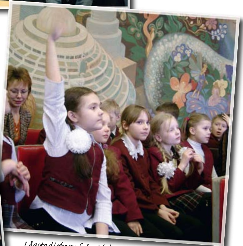
Lågstadieskolor från Elektrostal fick träffa Sune.