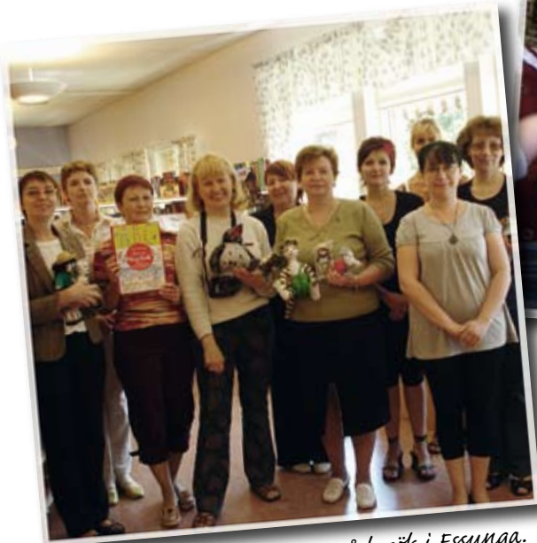
Ryska barnbibliotekarier på besök i Essunga.