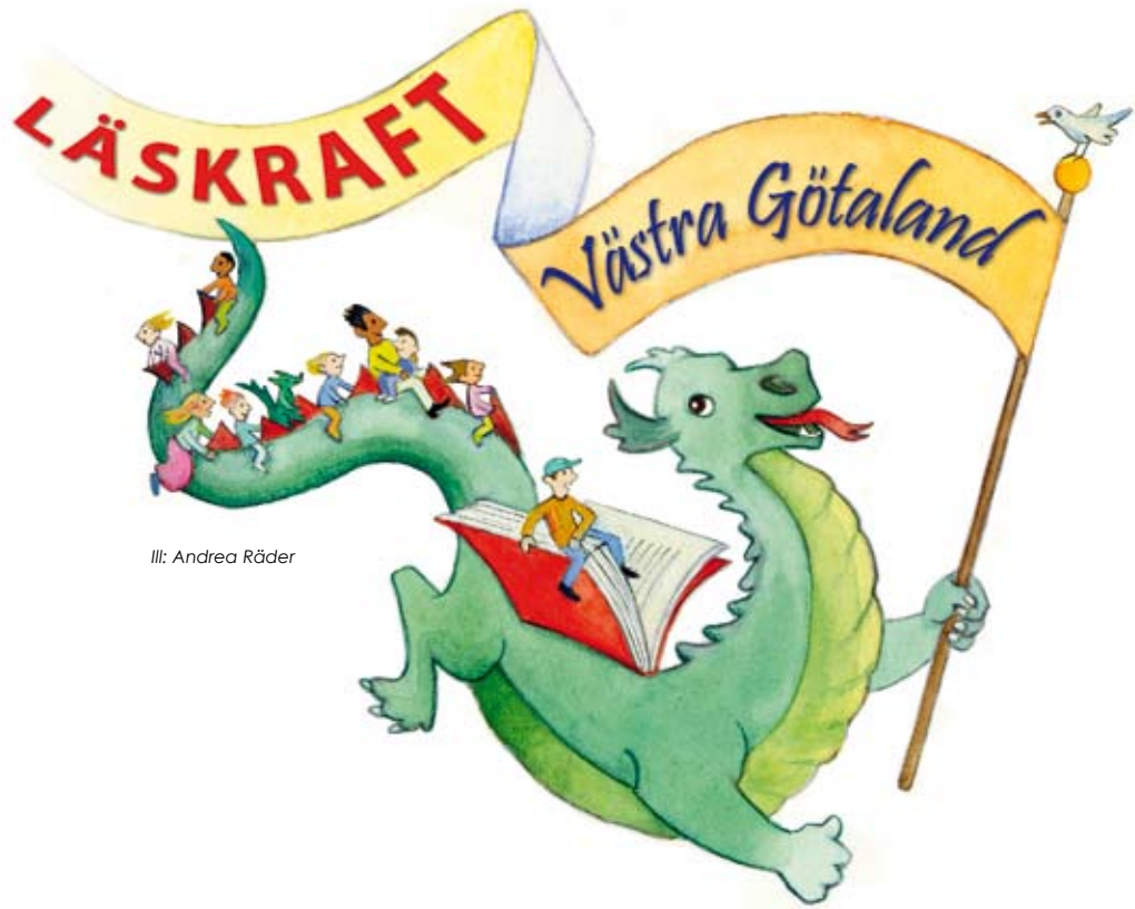
Ill: Andrea Räder

LÄSKRAFT Västra Götaland – är ett projekt som vill betona läsningens kraft både för individen och ur ett medborgarperspektiv. Ambitionen är att lyfta frågan om barns och ungas läsning högt upp på dagordningen bland beslutsfattare och politiker både regionalt och kommunalt. Projektet vill utnyttja den styrka det innebär att vara många som fokuserat arbetar mot samma mål men med olika målgrupper och med många olika metoder. De femton projektkommunernas bibliotek, förskolor och skolor vill utifrån lokala behov och tillsammans med barn och unga få inspiration från t.ex. dramapedagoger, skådespelare, berättare, musiker, filmpedagoger, författare och illustratörer. Gemensamt för Läskraftskommunerna är viljan att utveckla nya metoder för att öka språkglädje och läslust hos barn och unga. Läskraftskommunerna är: Ale, Borås, Falköping, Kungälv, Lerum, Mariestad, Mark, Munkedal, Mölndal, Skövde, Stenungsund,