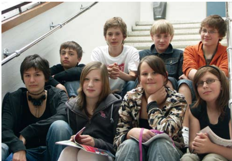
Framsidan samlade läsintresserade ungdomar ur biblioteksrådet på Vasaskolan i Skövde till ett samtal om läsning.

Det är inget fel på klassiker. Men själva ordet är kanske inte så lyckat om man vill locka till läsning?