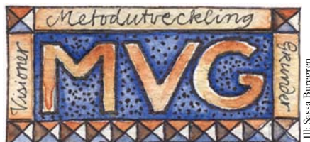
Ill. Sassa Buregren

MOT EN NY LITTERATURFÖRMEDLING FÖR BARN OCH UNGA