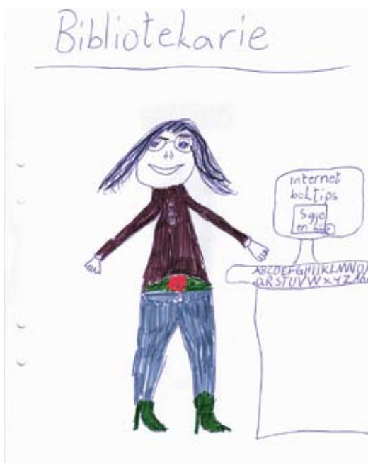
Barnen i undersökningen fick rita sin bild av en bibliotekarie.

Hon menar också att det finns en stereotyp bild av bibliotekarien och deras arbete i samhället – de är belästa, men töntiga och tråkiga