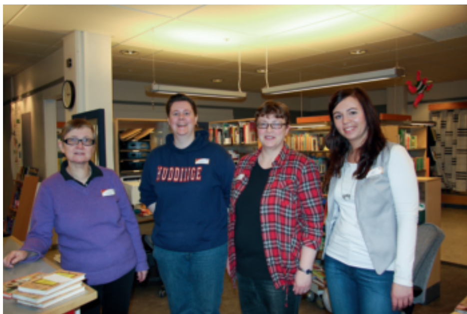
Tre av de fyra bibliotekarierna på biblioteket i Flemingsberg är barnbibliotekarier och barn och samarbete med skola och barnomsorg är prioriterad verksamhet.

Bibliotekets barnavdelning innehåller ungefär 15 av de vanligaste språken i området. Dessutom försöker man hela tiden komplettera och köpa nytt allt eftersom nya språk