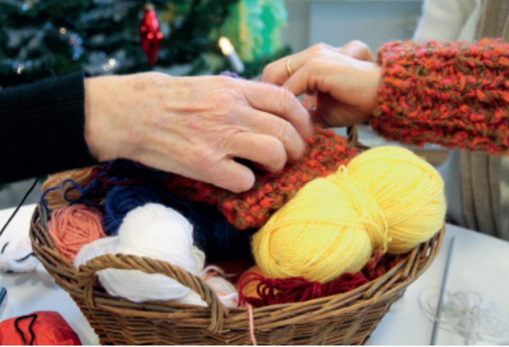
Pulsvärmare, tovade sittunderlag och virkade blommor är lite av det som produceras på mötesplatsens stickcafé. Och ganska mycket prat.