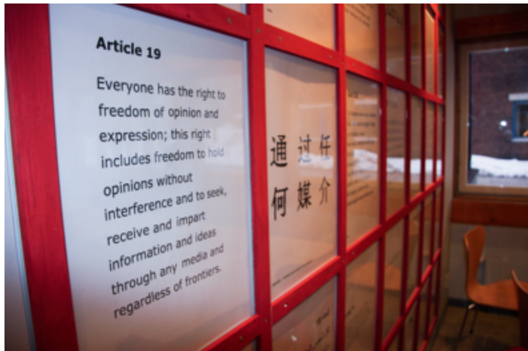
FN:s deklaration artikel 19 hänger på väggen som en ständig påminnelse om bibliotekets rättighetsperspektiv.