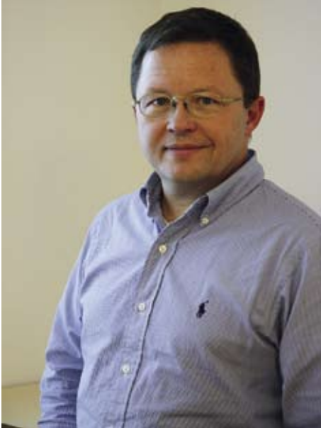
Tolkning. Flemming Munch menar att BibZoom och Lektier Online är en traditionell tolkning av biblioteksuppdraget.