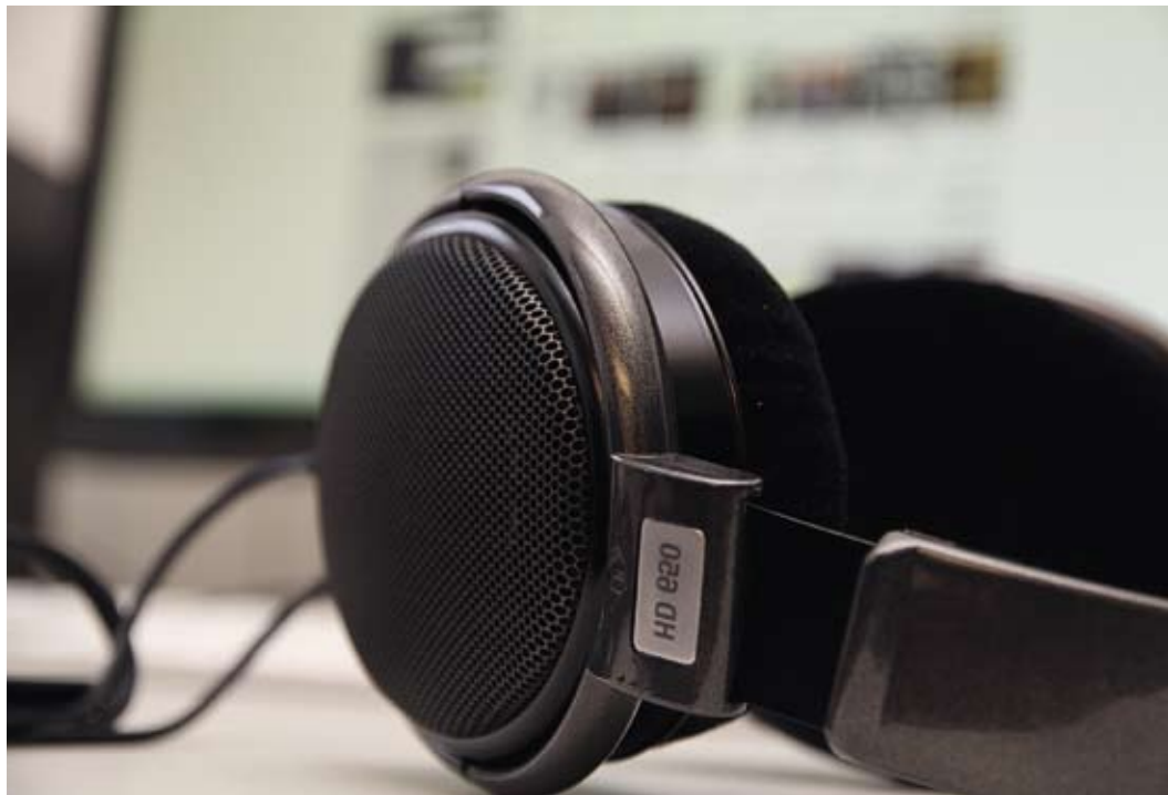
Digitala bibliotekstjänster i Danmark. BibZoom.dk erbjuder mer än 7,5 miljoner digitala musikfiler dygnet runt alldeles gratis.

BibZoom.dk började som ett nationellt bibliotek för musik men har sedan starten utvecklats till en webbplats med flera tjänster inom kulturområdet. Och intresset är stort,