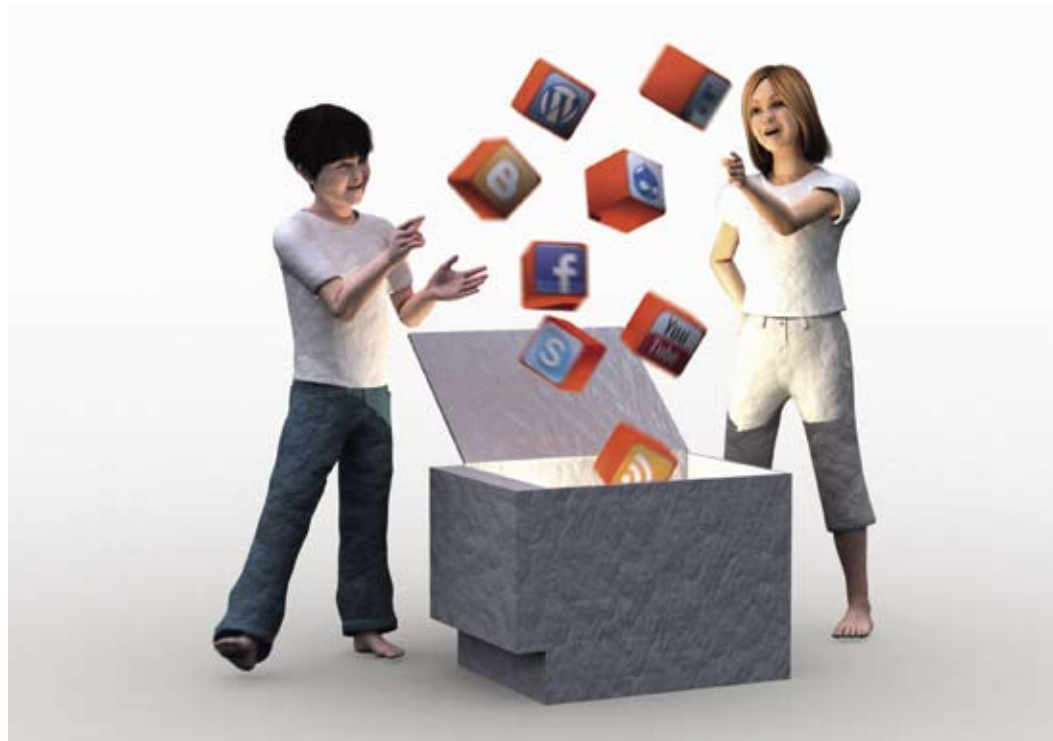
Illustration: Staffan Melin

– Det är mycket staden som bestämmer. Förut hade biblioteket en egen hemsida och