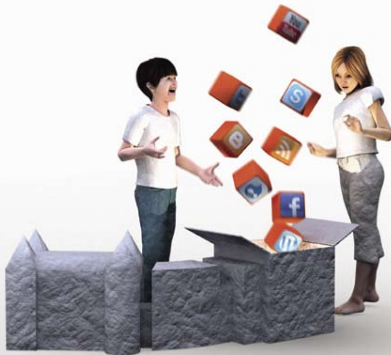
Illustration: Staffan Melin

– Vad ska vi som bibliotekarierna hjälpa till med? Är det rimligt att jag ska hjälpa den här äldre damen att boka en flygbiljett? Det är väl inte vad jag gör, jag förmedlar litteratur och information. Kan besökaren inte öppna ett hotmailkonto, ska jag hjälpa till med det? Ja, det ska vi idag. Här har vi ett gäng som är mer fokuserat på att hjälpa till med vad som helst, inte bara informativ sökning, en litteraturlista eller hitta boken i hyllan. Det vidgar begreppet biblioteket och vad vi ska ha för service, säger Per Mattsson.