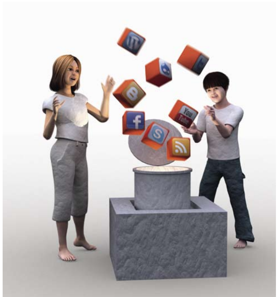
Illustration: Staffan Melin

Som ett led i att försöka riva dessa murar och komma ifrån de olika systemens inläsningseffekter, har man på biblioteket byggt den nya webben med så kallad öppen källkod.