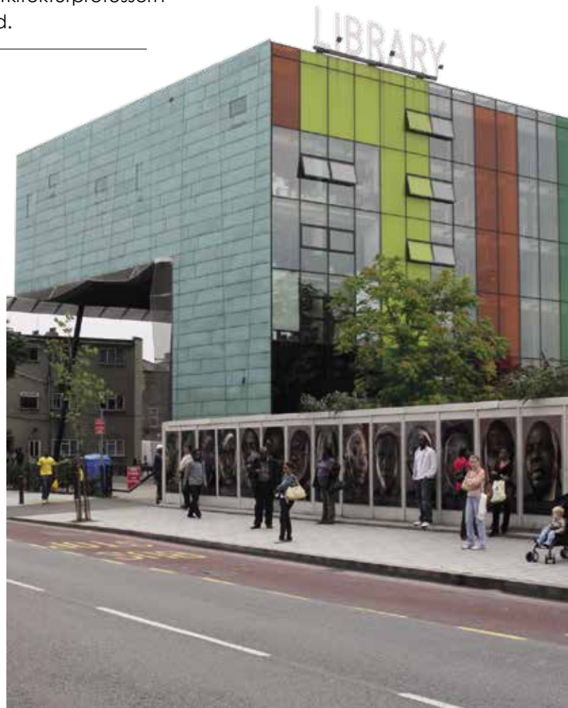
Ikon Biblioteket i Peckham i Londons södra delar är ett exempel på en prisbelönt ikonbyggnad. Formen ska föreställa ett liggande L.

andra. Men det handlar inte om för eller emot, utan om en balans. Jag kan tycka att det finns något djupt sympatiskt i det lättillgängliga som exempelvis ett tunnelbanebib-