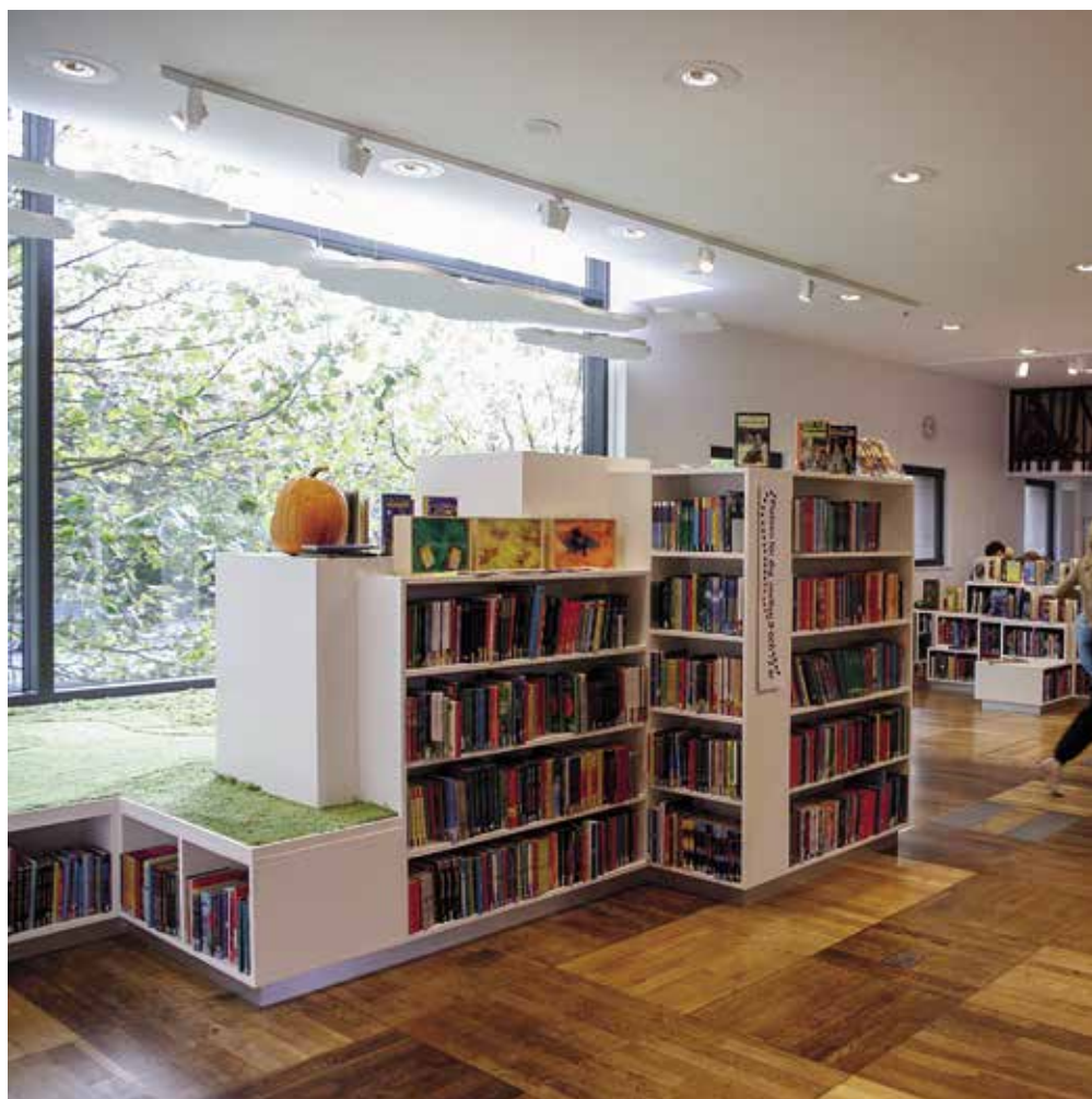
Öppet Balagan har en öppen planlösning och man har valt att placera avdelningen i anslutning till vuxenavdelningen.

Egentligen består Balagan av två delar där det fysiska rummet kompletteras med en digital del som heter Berättarexperimentariet. Berättarexperimentariet fungerar dels som ett slags Community med chatfunktion, tävlingar, boktips och evenemangstips, men här finns också ett bildarkiv och program för att skriva och skapa såväl böcker som film.