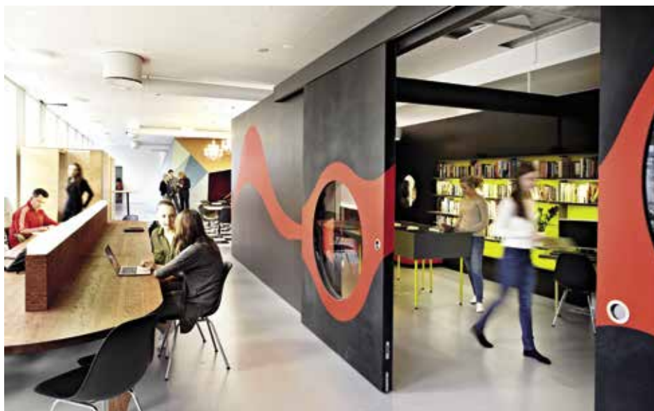
Novet Bibliotekets centrala placering på skolan har gjort det till en naturlig samlingsplats och en plats för litteratur och information.