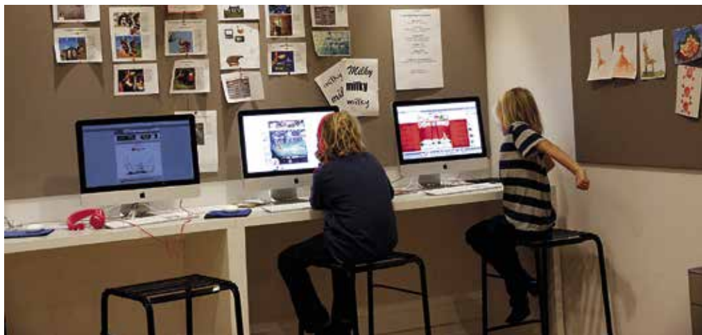
Variation Balagan har fokus på berättande och är full av kojor och platser för läsning och kreativt arbete.

vars behov vi inte visste så mycket om, säger Anna. De var på biblioteket, men de syntes inte.