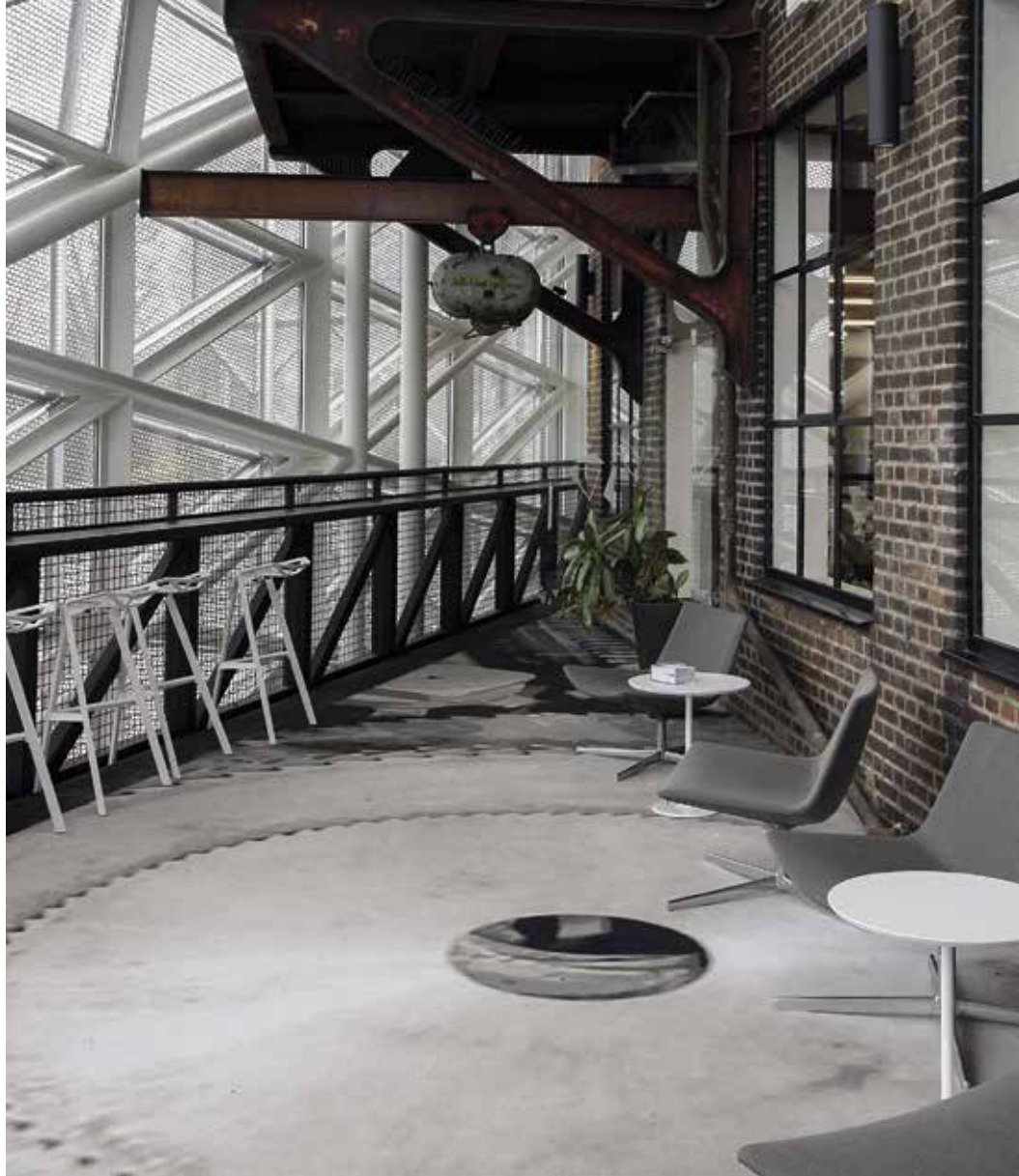
Allt under ett tak Kulturværftet består av flera byggnader och organisationer under ett tak. Här finns bland annat bibliotek, restaurang och varvsmuseum. Biblioteket ligger centralt placerat i tre plan och hela huset andas modern arkitektur med många detaljer sparade från den gamla varvsmiljön.

De allra flesta Helsingørbor har nu också gett med sig och tycker att omvandlingen från skeppsvarv till kulturvarv inneburit en stor vinst för både dem och för staden och i framtiden finns det idéer om att också placera utbildningsinstitutioner på området.