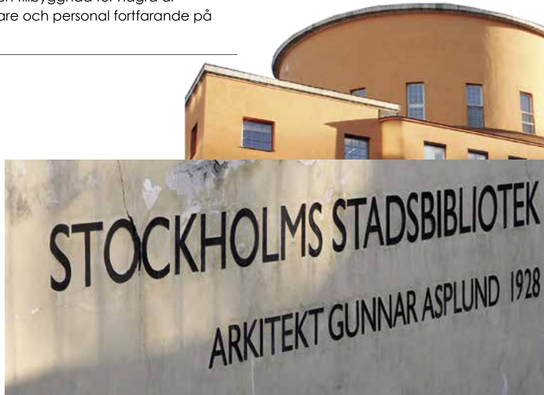
Ikon Stockholms stadsbibliotek är en förebild för många andra biblioteksbyggnader och stilriktningen kallas i övriga världen för Swedish grace.