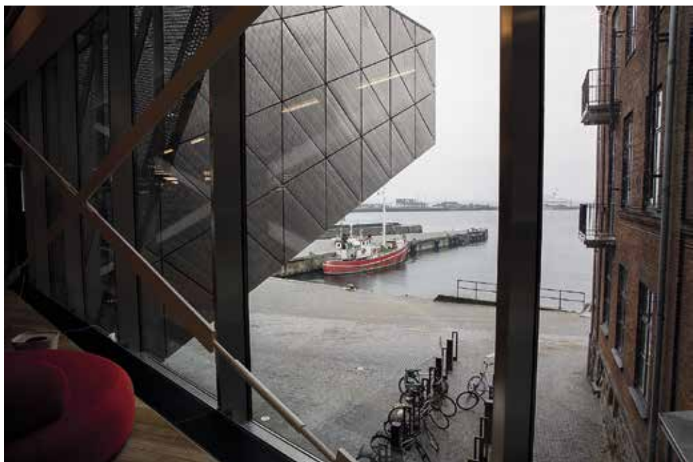
Förvandling Kulturværftet är den första etappen i förvandlingen av hela Helsingørs hamnområde från Kronborg till inre hamnen vid färjestationen.

Den första delen, Kulturværftet, är redan klar. De tre övriga omfattar landskapsprojektet ”Kulturhavn Kronborg”, ett splitternytt sjöfartsmuseum i den gamla torr-dockan, och en omfattande restaurering av