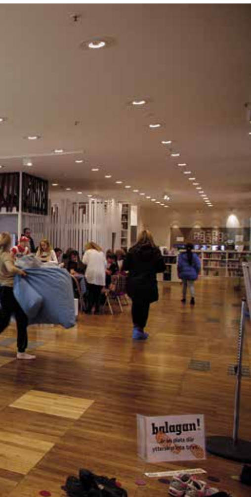
ingen Ljusets Kalender med skönlitteratur, språk och musik.