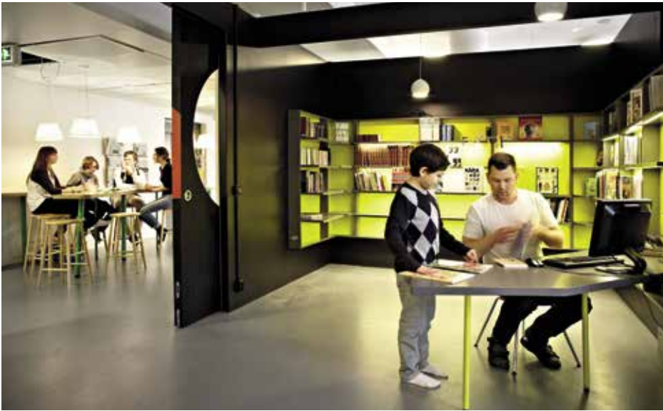
Skattkista Rosan Bosch har skapat ett bibliotek hon vill eleverna ska uppleva som en skattkista fylld med saker att upptäcka.

jobbat med ljus och mörker och de gula bokhyllorna, som är belysta, står i stark kontrast till den svarta omgivningen. Rummet har två dubbla skjutdörrar som enkelt ändrar rummet från ett genomgångsrum till ett slutet rum.