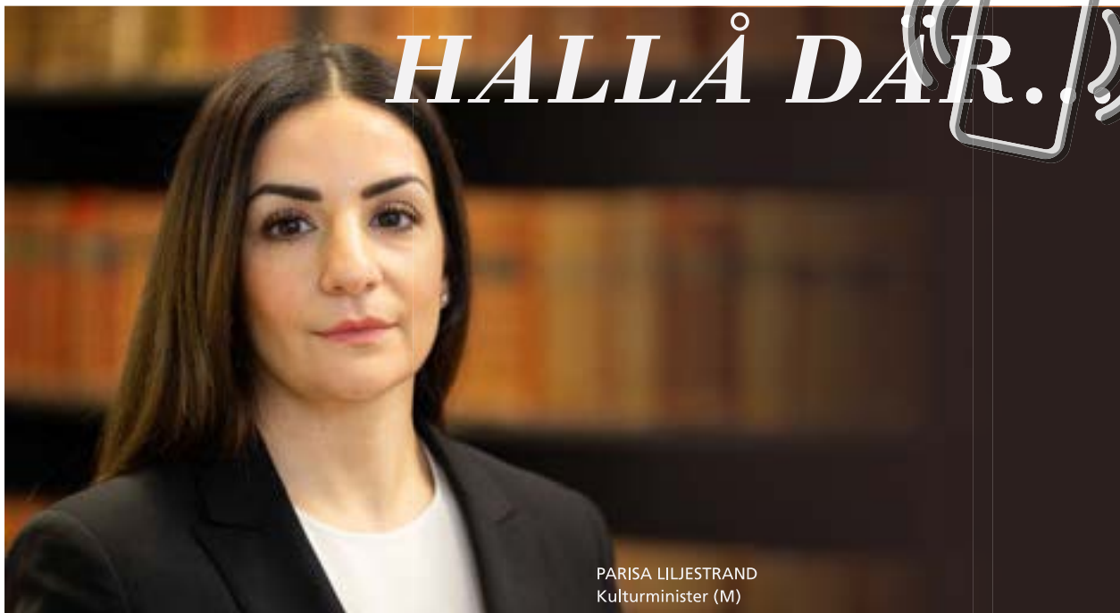
PARISA LJLJESTRAND Kulturminister (M)

Kulturminister Parisa Liljestrand har varit tydlig med att det ska vara armlängds avstånd mellan politiken och kulturens innehåll. Det senaste året har det dock förekommit flera exempel där politiker har haft synpunkter på kulturens innehåll. Noll27 fick känna kulturministern på pulsen med några snabba frågor i ämnet armlängds avstånd.