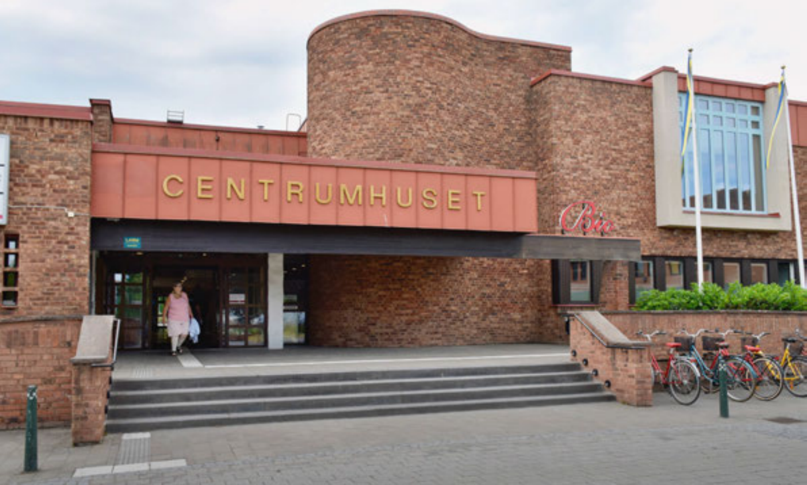
OVAN: GÖTENE BIBLIOTEK, CENTRUMHUSET. NEDAN: GÖTENE BIBLIOTEK OCH MEDBORGARKONTOR.